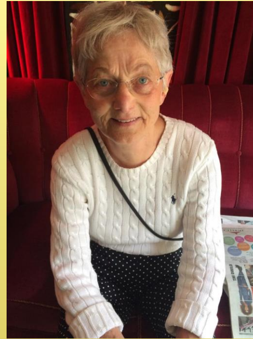
Jytte 1933, Kbh. K, Medlem "Jeg synes Samlingspunktet er et meget hyggeligt sted, for os som er pensioneret og har masser af tid, kan besøge. Her er der forskellige arrangementer og godt selskab".