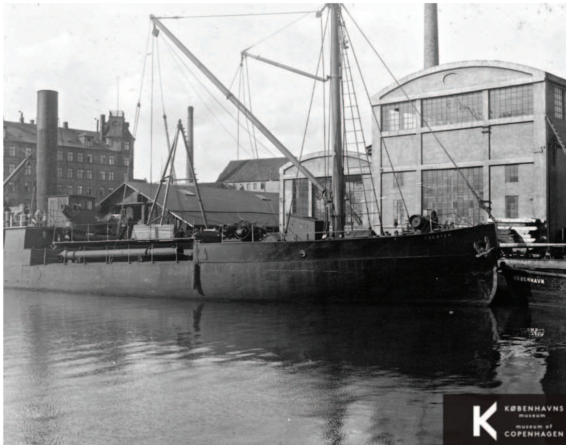
Wilders plads

Bygherre har igennem hele områdets historie været ejer af området og har dermed et stort kendskab til stedet og dets historik, samt et klart mål om at værne om stedets kvaliteter.