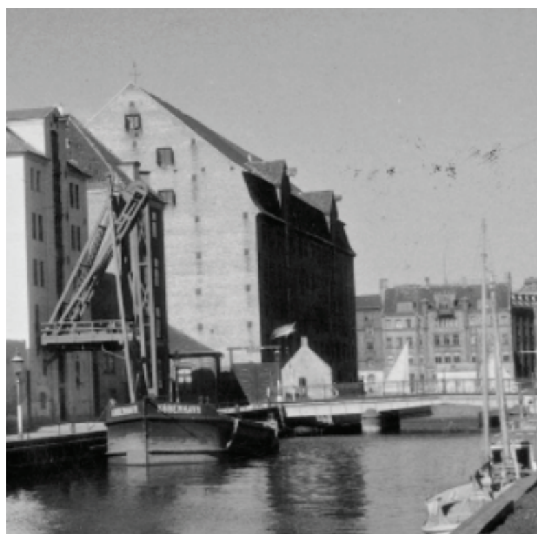
Wilders Kanal, 1865