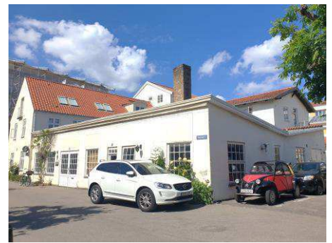
Eksisterende bygninger på Wilders Plads 9 set fra syd. Bygningen i forgrunden (nr. 9B, 9C og 9D) nedrives og de højere bygninger i baggrunden (9A, 9E, 9F og 9G) bevares.

De to byggefelter har en markant større grundplan end de øvrige mindre bygninger mod nordvest, hvor bygninger mod nordøst er markant større end byggefelterne. Udfordringen bliver at tilpasse nybyggeri skalamæssigt til stedet (højde, omfang udtryk og detaljering) så det på en naturlig måde indgår i det sammensatte område og samtidig er en naturlig overgang til de overordnede byrum langs Christianshavns kanal og Wilders Kanal.