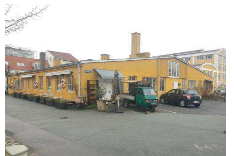
Eksisterende bygning på Wilders Plads 11A og 9B set fra syd. Bygningen nedrives.