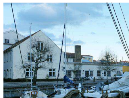
Eksisterende bygning, Wilders Plads 9, set fra vest. Bygningen tv bevares og den lave bygning th. nedrives.