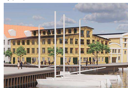
Eksempel på nybyggeri, Wilders Plads 11, set fra syd. Illustration: Lundgaard & Tranberg Arkitekter.