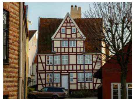
Eksisterende bygning på Wilders Plads 7. Bygningen er fredet og bevares. Foto: Lundgaard & Tranberg Arkitekter.