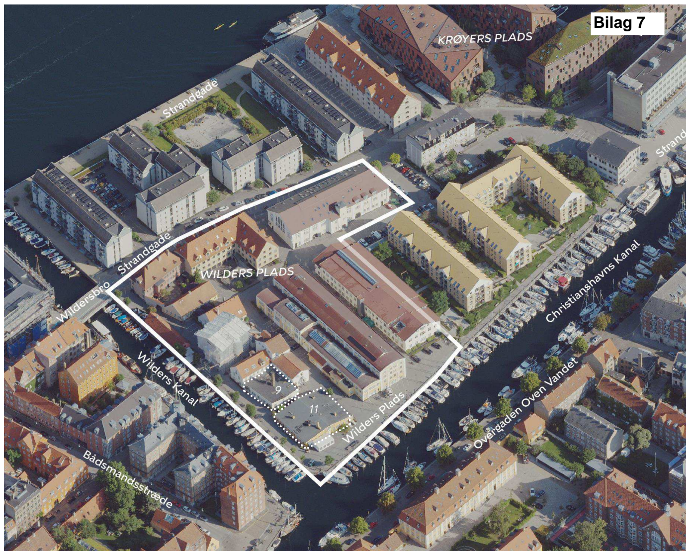
Området set mod nord. Lokalplanområdet er indtegnet med hvid linje, byggefeltene er markeret med stiple og de vigtigste gader og kanaler er navngivet.