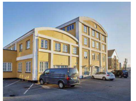
Eksisterende bygninger på Wilders Plads 8. Bygningerne er udpeget som bevaringsværdige og bevares. Foto: Lundgaard & Tranberg Arkitekter.