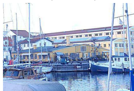
Eksisterende bygning Wilders Plads 11, set fra syd. Bygningen nedrives.