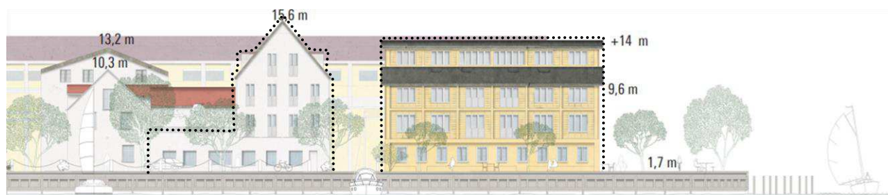
Eksempel på nyt byggeri markeret med stiple. Projekt på Wilders Plads 9 (tv) og 11 (th) med gavl og facade mod sydvest, set fra Wilders Kanal. Bygningshøjder er angivet i koter - terræn er i kote 1,7. Illustration: Lundgaard & Tranberg Arkitekter.