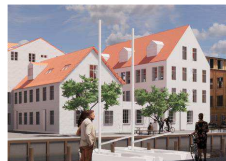
Eksempel på ny bygning, Wilders Plads 9, set fra vest. Bygningen tv. bevares og bygningen th. er ny. Illustration: Lundgaard & Tranberg Arkitekter