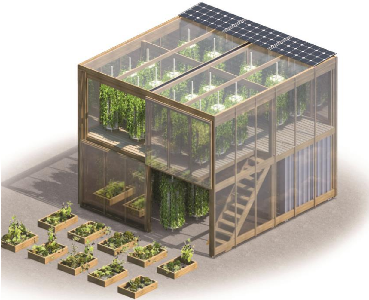
Hydroponisk bylandbrug. 6.000 kilo bladgrønt om året på 7*7 meter // Human Habitat