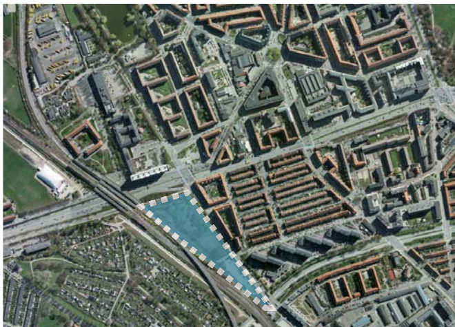
Lokalplan for Beauvaisgrunden muliggør erhvervs- og boligbyggeri.