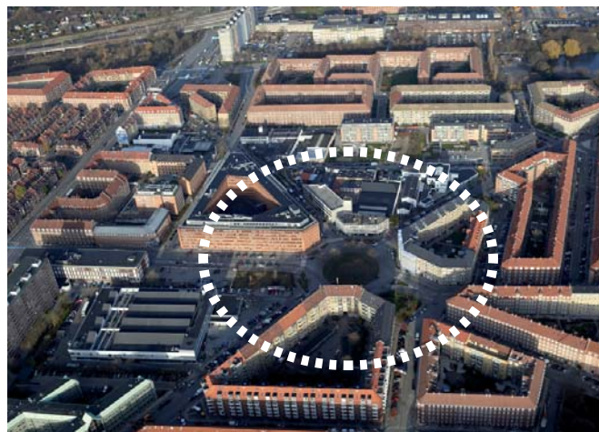
Området omkring Skt. Kjelds Plads rummer et stort potentiale for fortætning.