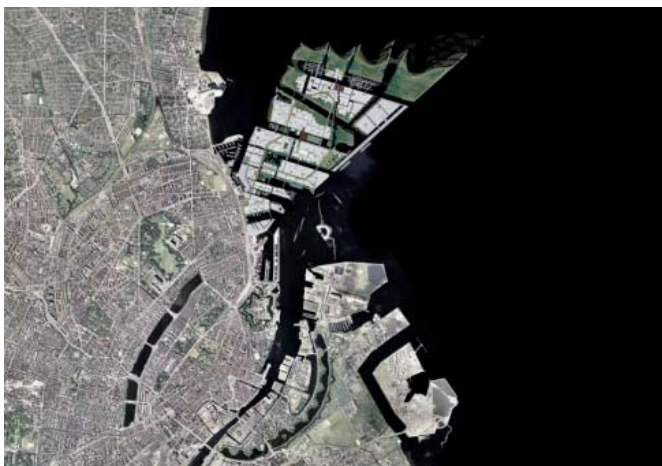
Nordhavn er det største udviklingsprojekt i Københavns Kommune