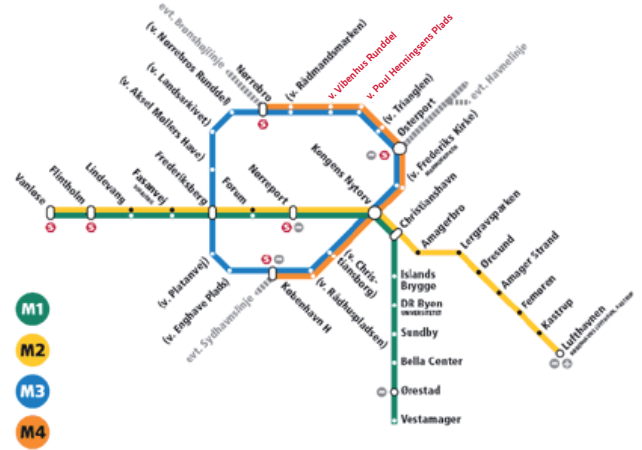
Med Cityringen kommer der to nye stationer i det nordlige Østerbro; Vibenhushjørnet og Poul Henningsens Plads.