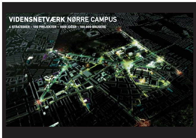
Nørre Campus udbygges de næste år for et tocifret milliardbeløb.

Den nye vej forventes at reducere trafikken på Lyngbyvej med ca. 15.000 biler i døgnnet, hvilket giver plads til en højklasset busforbindelse.