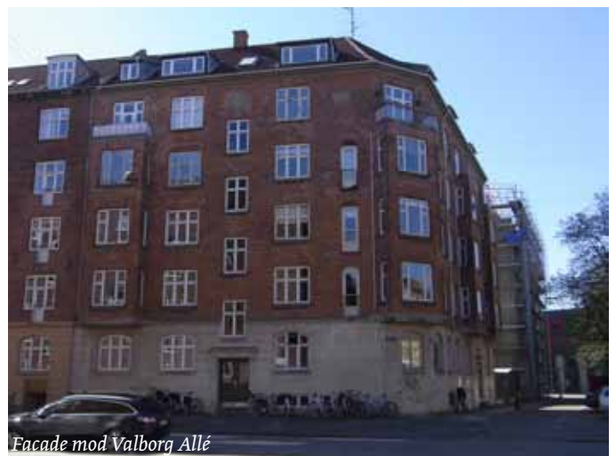
Facade mod Valberg Allé