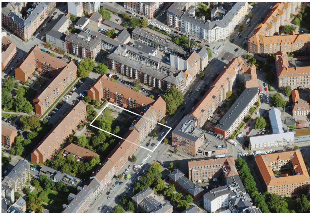
Området set mod nord. Lokalplanområdet er indtegnet med hvid linje, og de vigtigste gader er navngivet.

Baggrund for nedlæggelse af §14-forbuddet mod etablering af parkeringspladser på terræn er at bevare eksisterende gårdrum som et sammenhængende grønt fællesareal.