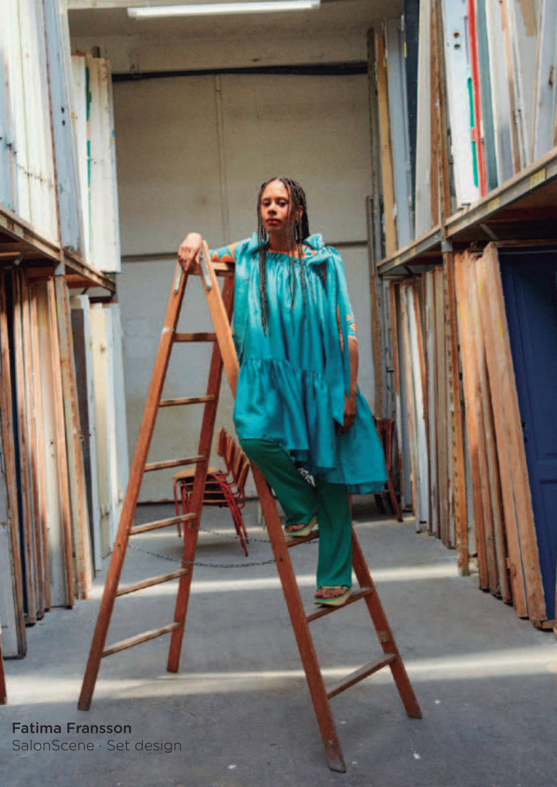
Fatima Fransson SalonScene · Set design