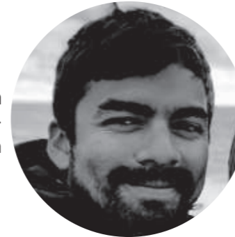
Ricardo A. León Video dokumentation · Video Documentation