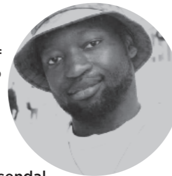
Mario S. Scharff SalonFoto · Salon Photo