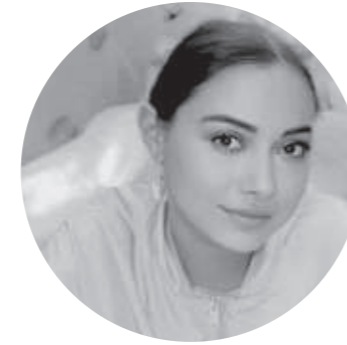
Alicia Zwetsloot SalonScene · Set design