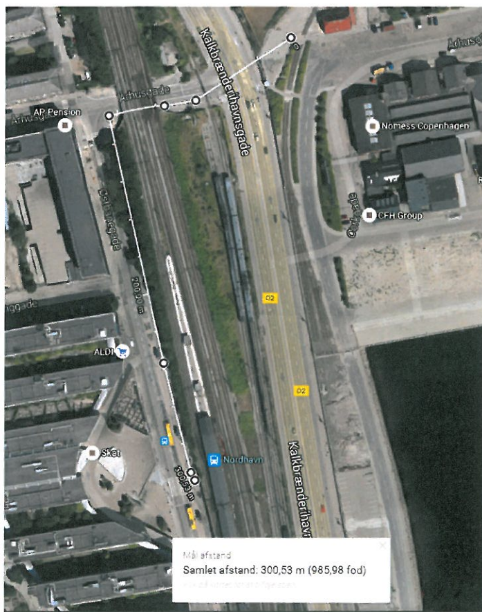
Figur 2 Forlænget gangafstand fra 100m til 300m ved undladt ombygning af Nordhavn S-togsstation

Såfremt Nordhavn S-togsperon ikke bliver forlænget og trappe ned til Århusgade ikke bliver etableret, så bliver gangafstanden mellem S-tog og metro blive forlænget fra 100m til 300m, og forlængelsen vil være i åbent terræn.