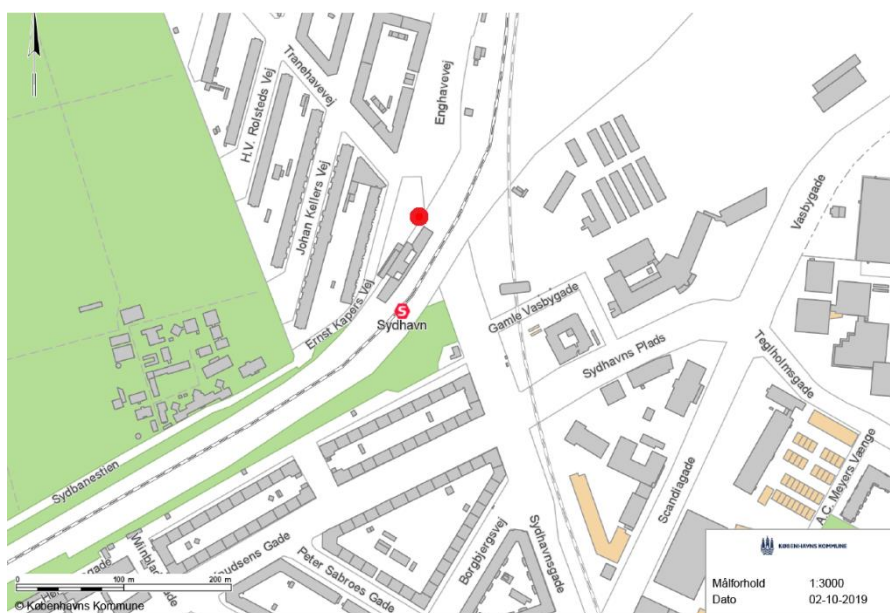
Kort 2: Forslag til placering af det permanente toilet på forpladsen ved Sydhavn Station på den anden side af jernbanen ud til Enghavevej

Det skal nævnes, at der kan være en risiko for, at toilettet skal fjernes midlertidigt i en periode i forbindelse med at Sjælør Boulevard skal skybrudssikres i perioden fra medio 2021 til 2022. Det endelige skybrudsprojekt er dog ikke færdigprojekteret, og derfor kendes det endelige projekt endnu ikke, og i hvilket omfang det vil påvirke toilettet, hvis det placeres her.