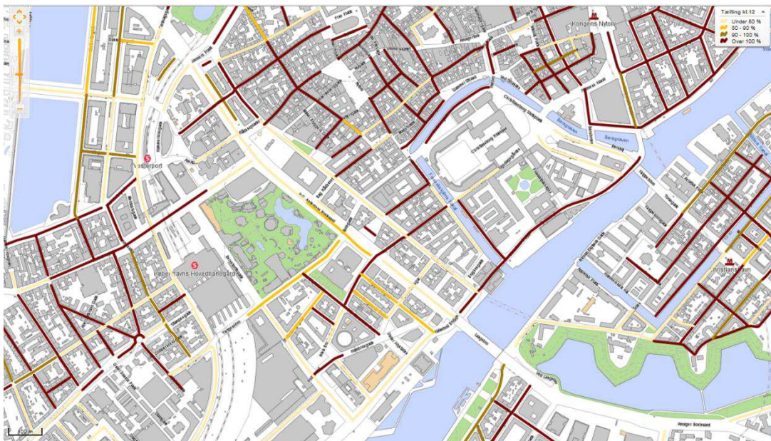
Figur 1: Parkeringsbelægning kl. 12.00.

Nedlægges parkeringspladserne vil det skabe mere pres på de bilister med beboerlicens som ønsker at parkere i nærområdet. Parkeringstællinger i området er angivet på figur 1-3.