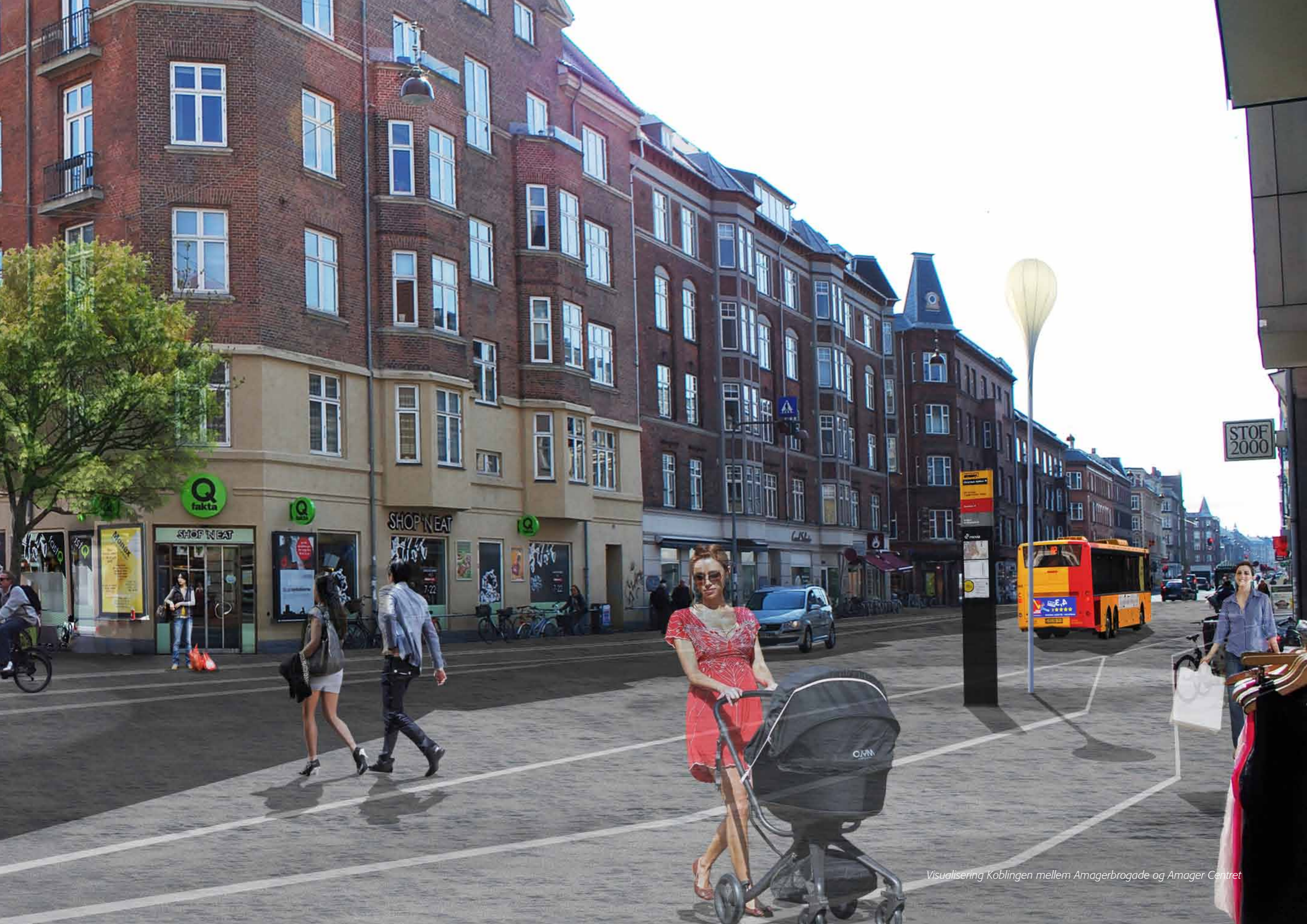
Visualisering Koblingen mellem Amagerbrogade og Amager Centret