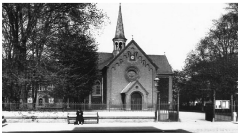
Historisk reference af Sundby Kirkeplads