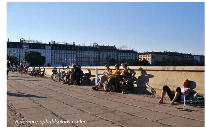
Reference opholdsplads i solen