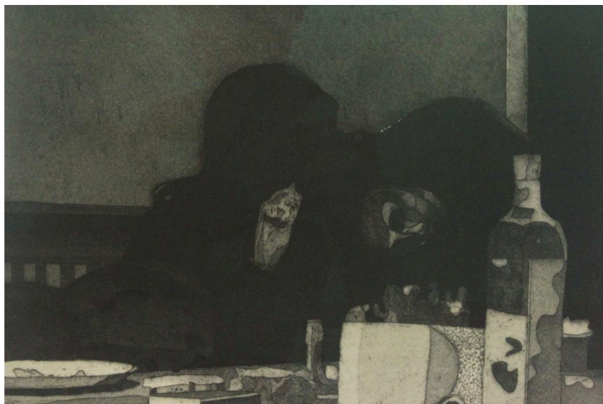
Et af værkerne fra udstillingen Nærkontakt i Danske Grafikeres Hus.