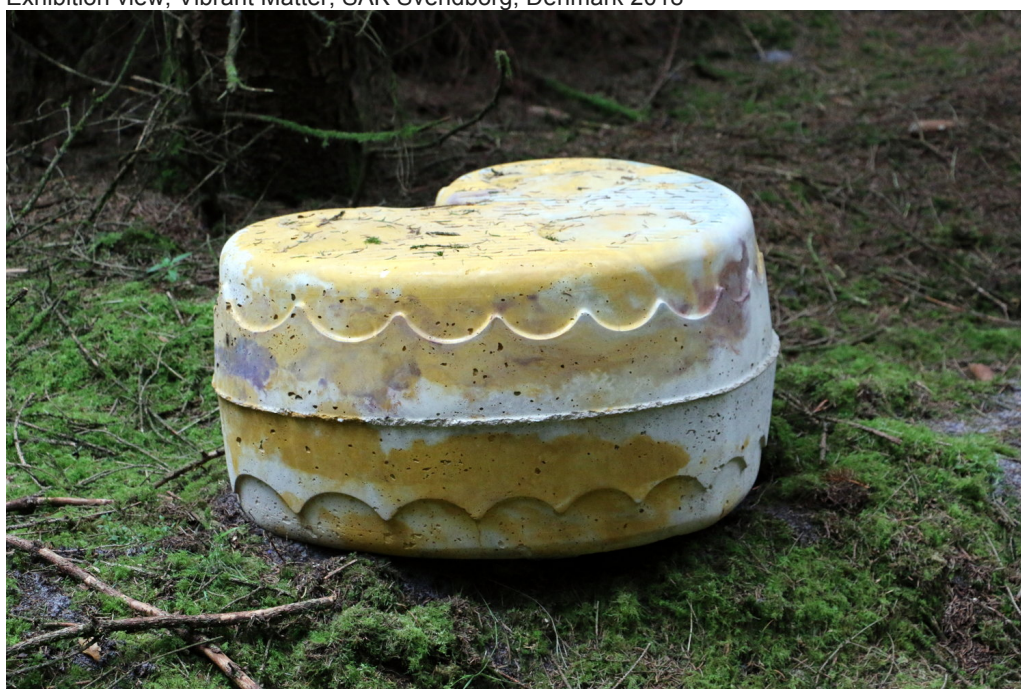
Johanne Skovbo Lasgaard / Garden Party Mineral Bath 2016 / Skov Snogen, Kibek / Beton, jern, pigment, skovens fald / 75 Ø x 45 cm.