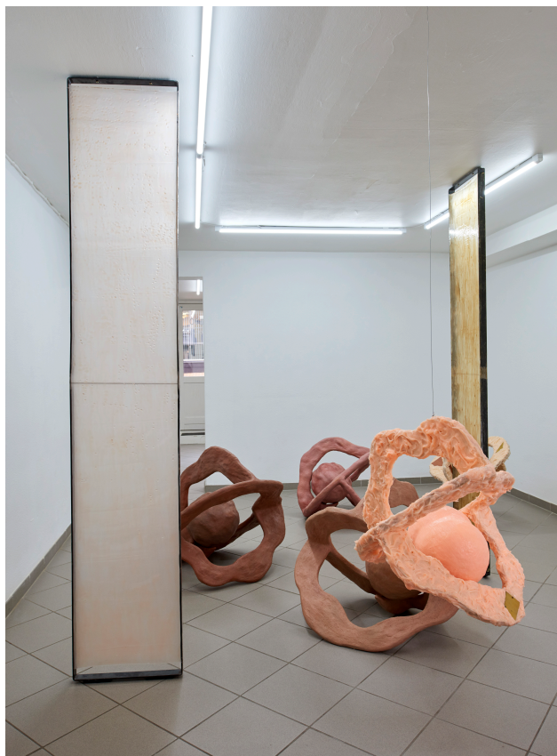
Louise Sparre / Vibrant at M100 / From left: Membrane 2019 / silicone, silk and iron / 227x40 x 4 cm. Standing sculpture: Cell Objects 2019 / concrete and wood / brown 80 Ø, pink 72 Ø, tan 75 Ø.