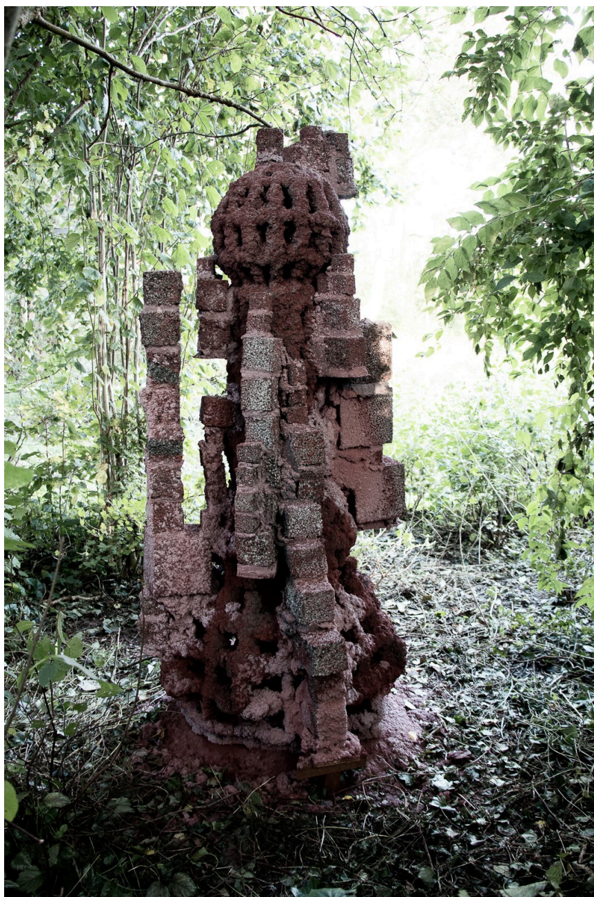
Rene Schmidt. Awaiting green colonies of fungus and moss to complete the 3D color scheme. Selde. DK