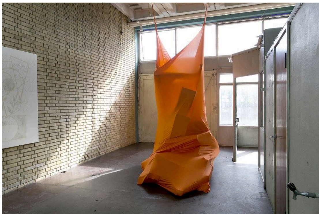
ELLEN HYLLEMOSE / Uden titel, 2016 / 500 x 180 x 200 cm. / Lycra, skum og reb.