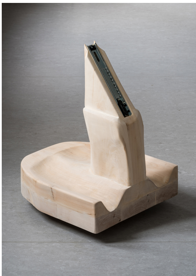
Nina Nowak / No title, 2018 / Linden wood, metal bar. 68 x 58 x 52cm / Photo: Davids Stjernholm. Exhibition view, Vibrant Matter, SAK Svendborg, Denmark 2018