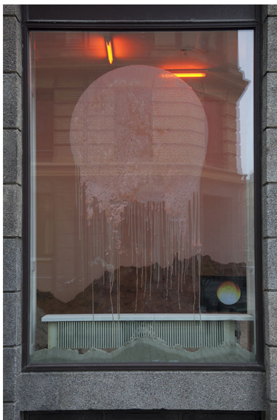
Barbara Amalie Skovmand Thomsen: Soleffekten II, 2016. Installation views.