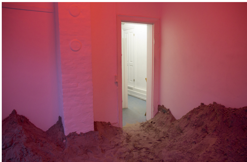
Barbara Amalie Skovmand Thomsen: Soleffekten II, 2016. Installation views.