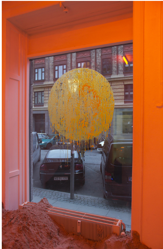
Barbara Amalie Skovmand Thomsen: Soleffekten II, 2016. Installation views.