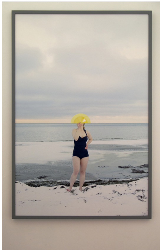
Barbara Amalie Skovmand Thomsen: Soleffekten II, 2016. Installation views.