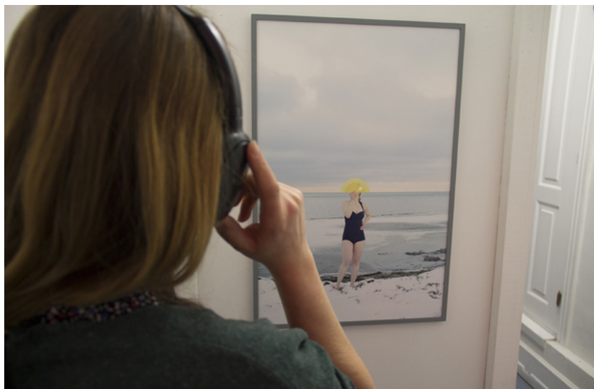
Barbara Amalie Skovmand Thomsen: Soleffekten II, 2016. Installation views.