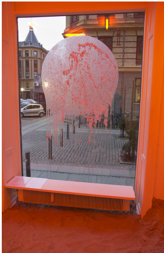
Barbara Amalie Skovmand Thomsen: Soleffekten II, 2016. Installation views.