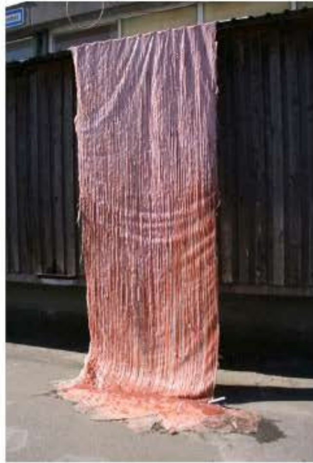
Charlotte Thrane, Tung i sproget, site-specific installation for the exhibition ENGROS at the old greengrocers market, DK, 2017 Materials: Pigmented silicone poured from roofs Dimensions: Two parts, each part H 6m x W 2m x D 1.4m