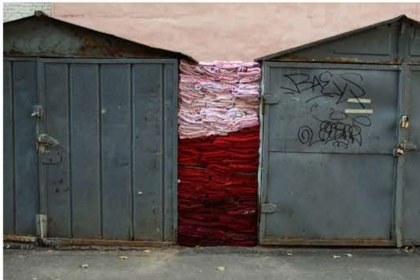
Charlotte Thrane, I Love you: Eight Gaps, site-specific installation for the 6th Art Prospect Festival, Russia, 2018 Materials: Used clothing sourced locally and stuffed in gaps between sheds Dimensions: Eight parts, each part between H 2.1m x W 0.2-1.2m