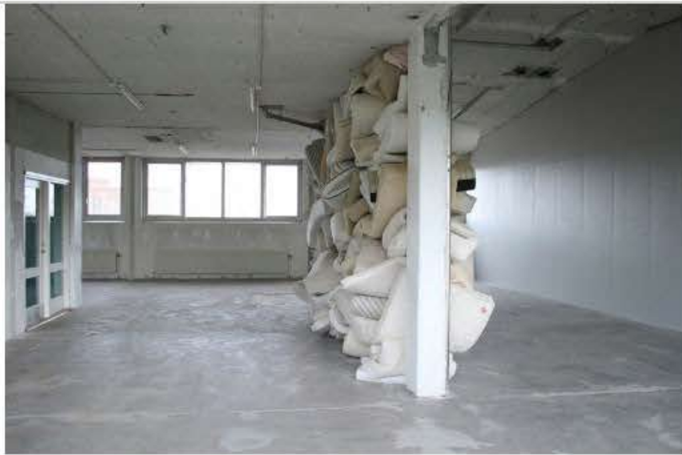
Charlotte Thrane, Big Body, site-specific installation for KH7 Artspace, DK, 2019 Materials: Used mattresses and cushions sourced locally and stuffed in a space between two pillars, the floor and ceiling Dimensions: H 3.2m x W 4.7m x D 1.4m