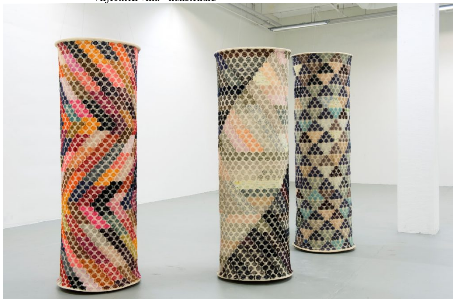
Ragna Brasse: Søjlerne fra Uruk , ca. 1985.

Det næste rum er det sværeste, langt og smalt, men her får Franka Rasmussens værker plads på væggene. Særligt interessante synes jeg de to papirværker er, som jeg ikke ved om hun egentlig har tænkt som skitser til større installationer, hvor hun arbejder grafisk klart og med papiret som et tredimensionalt materiale, der synes at sprænge sit eget format med en voldsom dynamik, som jeg ikke helt genfinder i hendes fysiske relieffer, hvor det i højere grad virker som om det er mødet mellem materialernes karakterer, der har drevet hende.