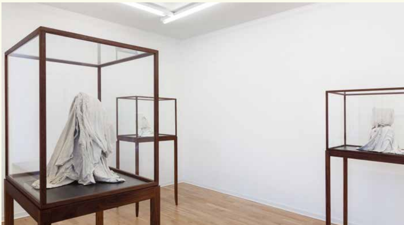
Valérie Collart: Enigme 1, Enigme 2 og Enigme 3, 2017. Gips, stof og forskellige materialer. Montrer i kastanje og laminat.