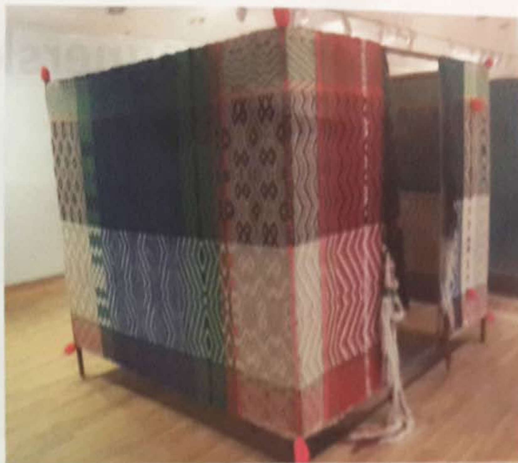
Ragna Braase. Afrikans hus

Kastrupvej 299, Kastrup Frem til 27. maj