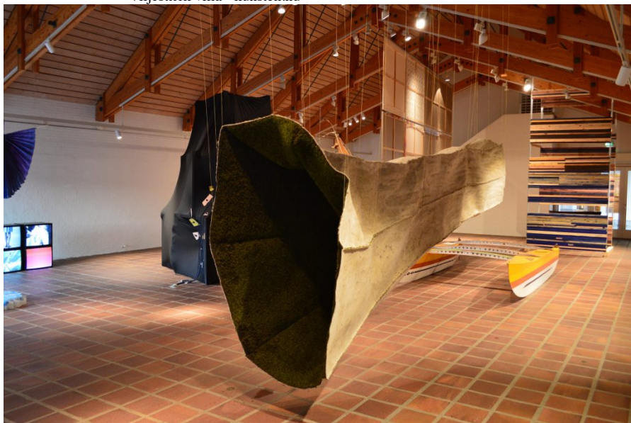
Villa til Ragna og Franka, installationsview.

Et af de værker, som rykker kropsligt er Ellen Hyllemoses store sorte ting – underflade/overflade, indånd/udånd (2017) Et monstrum af et værk, en udadstikkende konstruktion holdt sammen og skjult bag sort lycra, som står og troner lidt faretruende i rummet. Uden på er der påsat lapper og knapper i lysende farver, som får konstruktionen til at virke endnu mere tykmavet, en som også giver den en malerisk dimension. Fra et par af dem hænger der blåt tovværk, som man kender det fra sejlbådsskøder, hvilket på en fin måde skaber en forbindelse til Poul Gernes store bemalede og blomstertapetserede katamaran. Uden tovværk sejler man ingen steder. Det begynder med en tråd.