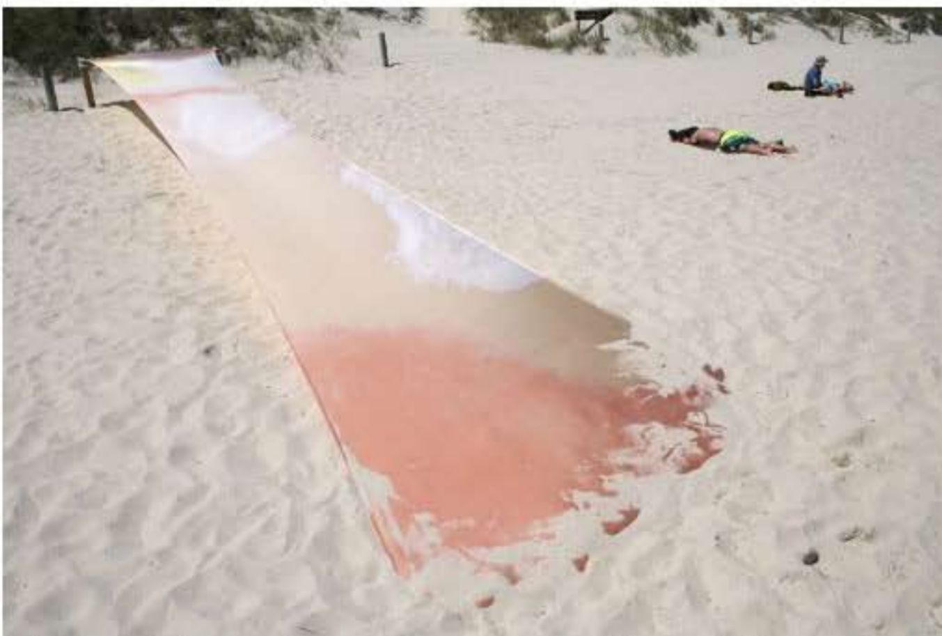
Charlotte Thrane, Sun Strips, site-specific work for Sculpture by the Sea, Australia, 2016 Materials: Rope, steel tubes and swimsuit material exposed to bleach, dye, daylight lamps, self-tanning lotion, and sunbeds in Denmark, and sunlight, sand and wind in Australia. Dimensions: Three lengths, each length H 18m x W 2.4m