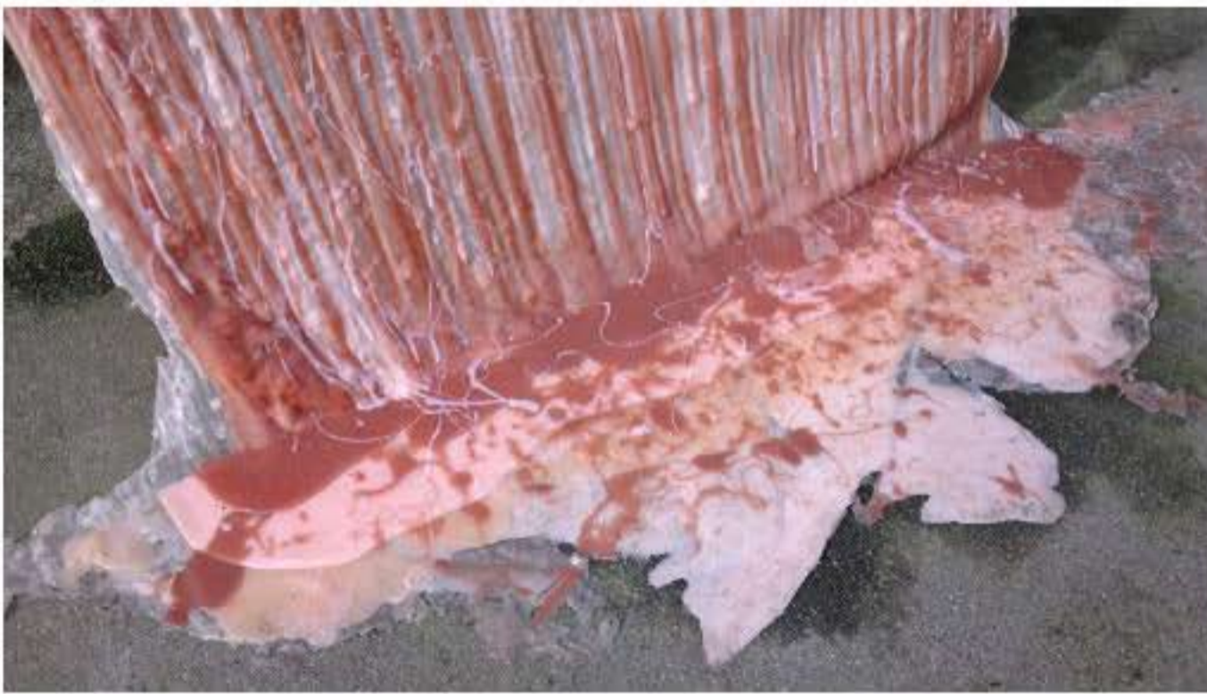
Charlotte Thrane, Tung i sproget, site-specific installation for the exhibition ENGROS at the old greengrocers market, DK, 2017 Materials: Pigmented silicone poured from roofs Dimensions: Two parts, each part H 6m x W 2m x D 1.4m