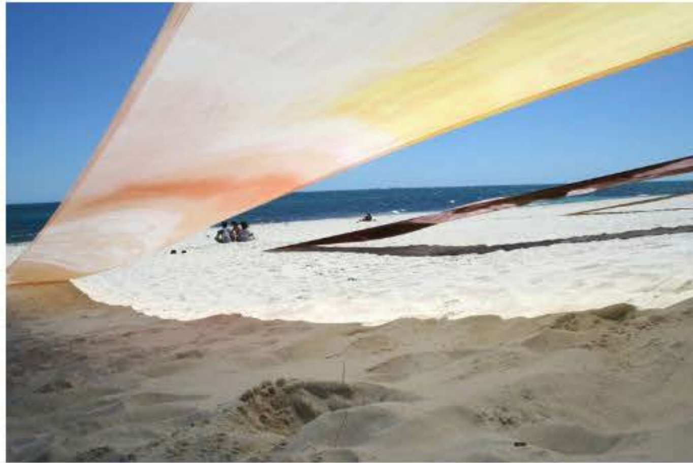
Charlotte Thrane, Sun Strips, site-specific work for Sculpture by the Sea, Australia, 2016 Materials: Rope, steel tubes and swimsuit material exposed to bleach, dye, daylight lamps, self-tanning lotion, and sunbeds in Denmark, and sunlight, sand and wind in Australia. Dimensions: Three lengths, each H 18m x W 2.4m

Dimensions: Three lengths, each length H 18m x W 2.4m