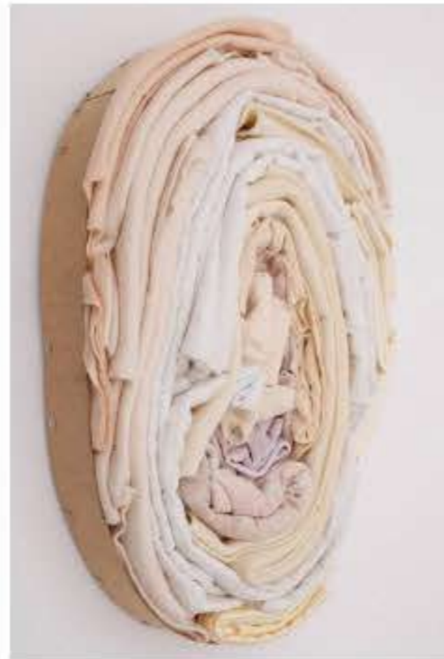
Charlotte Thrane, Untitled (relief), 2019 Materials: Used, folded clothing and wood Dimensions: H 37cm x W 57cm x D 8cm