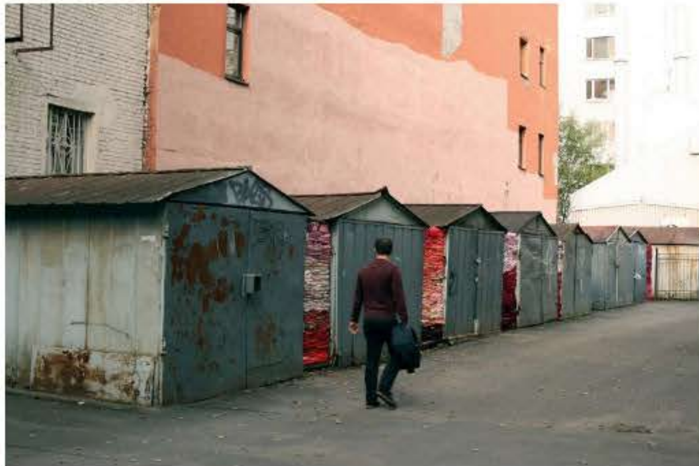
Charlotte Thrane, I Love you: Eight Gaps, site-specific installation for the 6th Art Prospect Festival, Russia, 2018 Materials: Used clothing sourced locally and stuffed in gaps between sheds Dimensions: Eight parts, each part between H 2.1m x W 0.2-1.2m