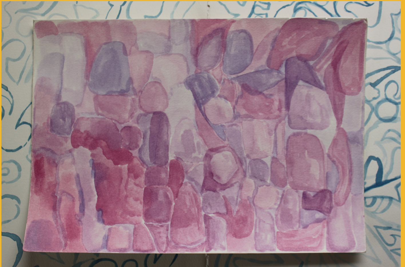
Overst: MISFITS - skitse på papir, 2020 - Deirdre J. Humphrys Nederst: Akvarel skitse på papir, 2020 - Deirdre J. Humphrys