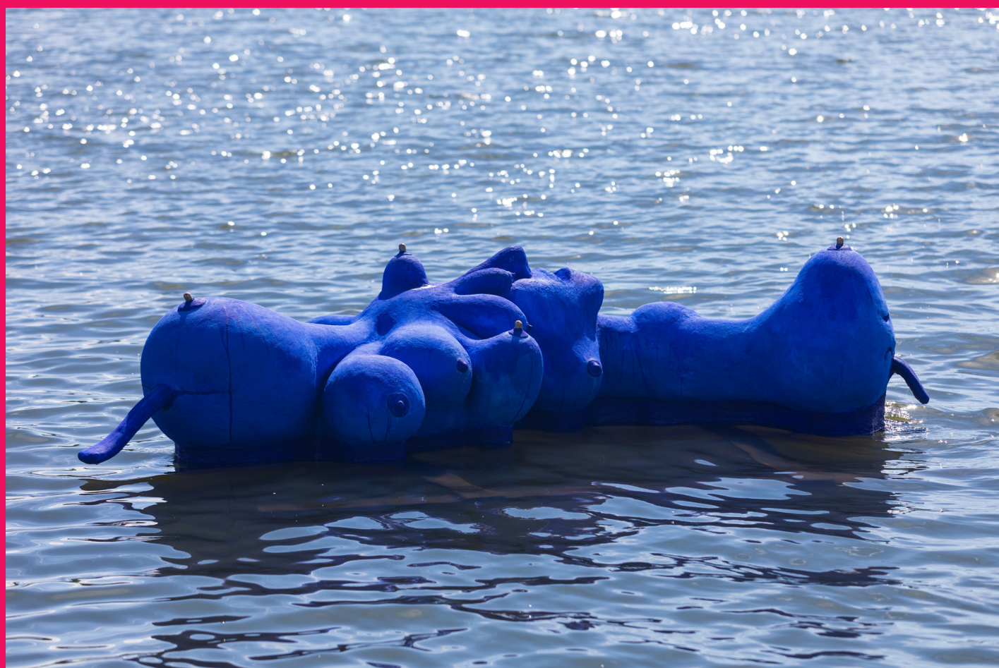
Water Wet Nurse , Springvand af fiberbeton, dysser af messing, 430x 150x120 cm, Cry me a River, Vejle 2019 - Mia I. Edelgart