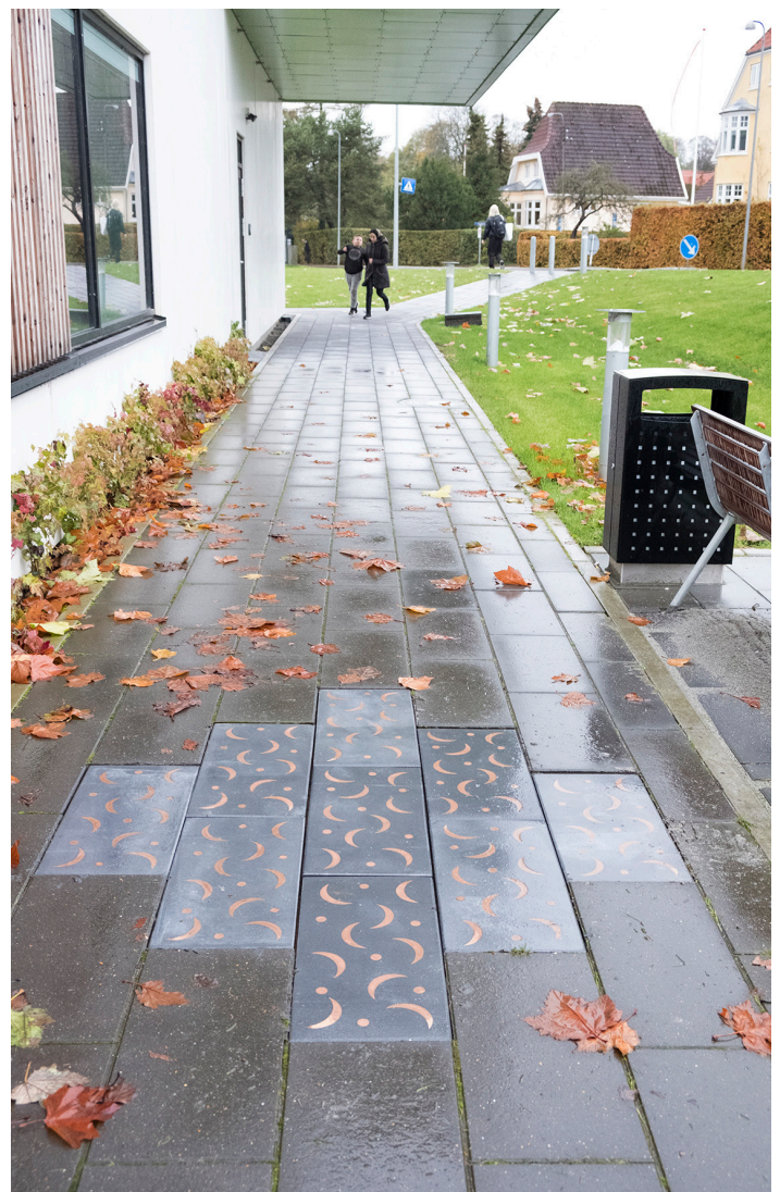
FUNDET, Regionshospitalet Horsens, 2020

Skulpturen: Beton og rustfrit stål med mirrorfinish L:400 B:300 H:200 cm.