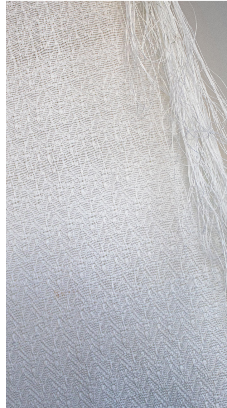
Udstit af håndvævet tekstil, LIFE OK 1/2