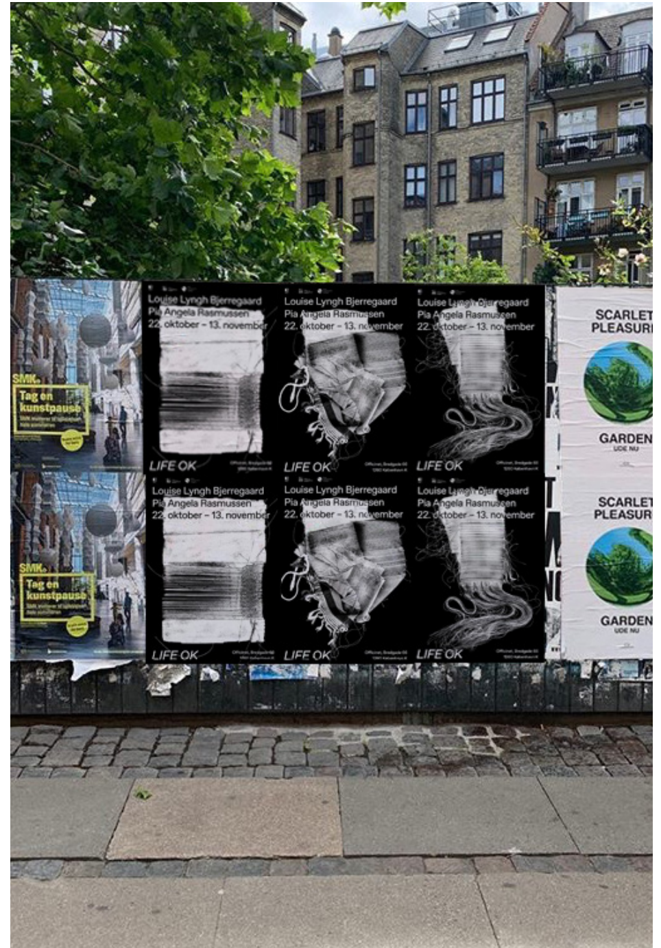
LIFE OK - Plakater i byrummet Skitseforslag til ophængning af plakater. Egen billedredigering.