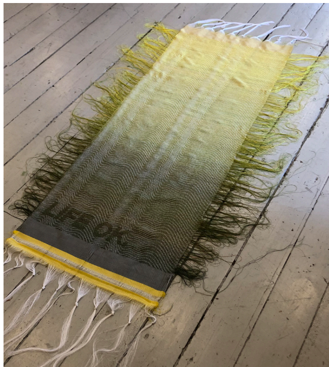
LIFE OK - Statens Værksteder for Kunst 2019.