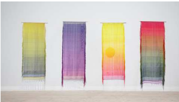
LIFE OK Serie 1 & 2. Samlet serie, skitse til ophængning, Officinet.