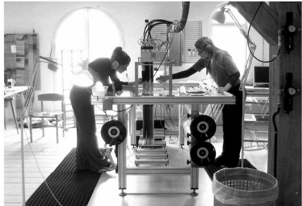
Statens Værksteder For Kunst, maj 2019.

Tidligere udstillingssteder som kunstnerduo: Overgaden, Institut for Samtidskunst, august 2019 med værket Aerial Body Commercial.