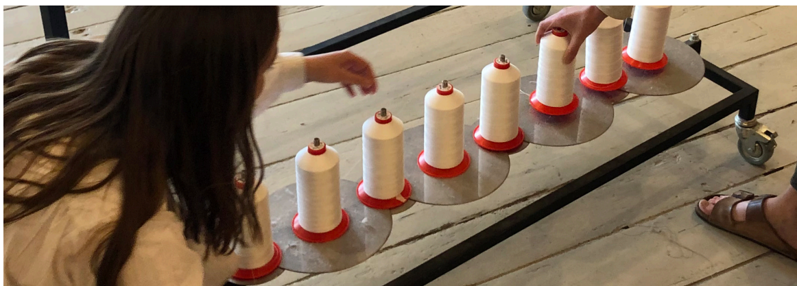
LIFE OK Serie 1. Opsætning og vævning på computerstyret og håndholdt ARM væv.