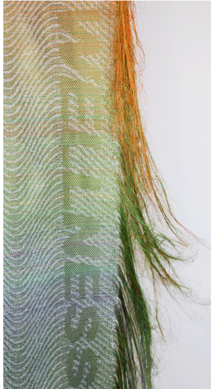
Udstit af håndvævet tekstil, WELLNESS (LIFE OK 4/4)