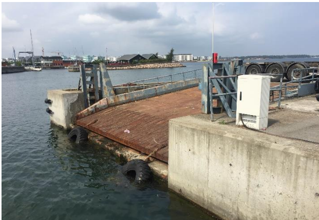
Den sydlige del af ro-ro rampen (færgerampen) Eksisterende jernbanespor lang Kalkbrænderihavnskaj

Den tidligere runde kranbane, der var placeret i det sydvestlige hjørne af Svanemølleholm, vil give inspiration til udformning af den kommende park, Kranparken, der er planlagt på samme lokation. Derudover vil der blive brugt bygningsmaterialer i de nye bygninger som har reference til de eksisterende bygninger, så som stål, tegl, beton og træ.