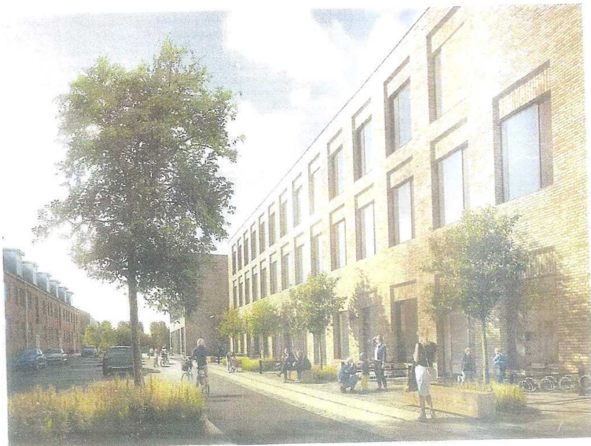
Skolen langs med Hvidbjergvej, set fra hjørnet af Hanstholmvej. Ill.: TRUST.

Med venlig hilsen Bestyrelsen på Hvidbjergvej