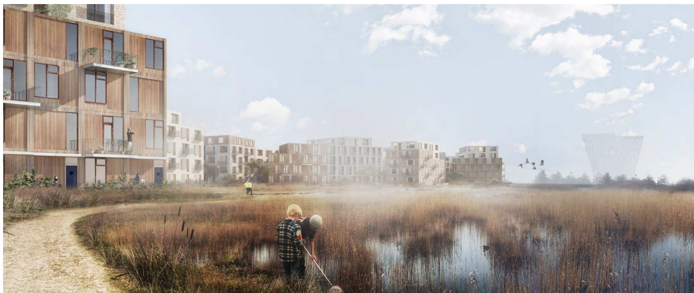
Bebyggelsen set fra fælleden. Visualisering af Tegnestuen Vandkunsten