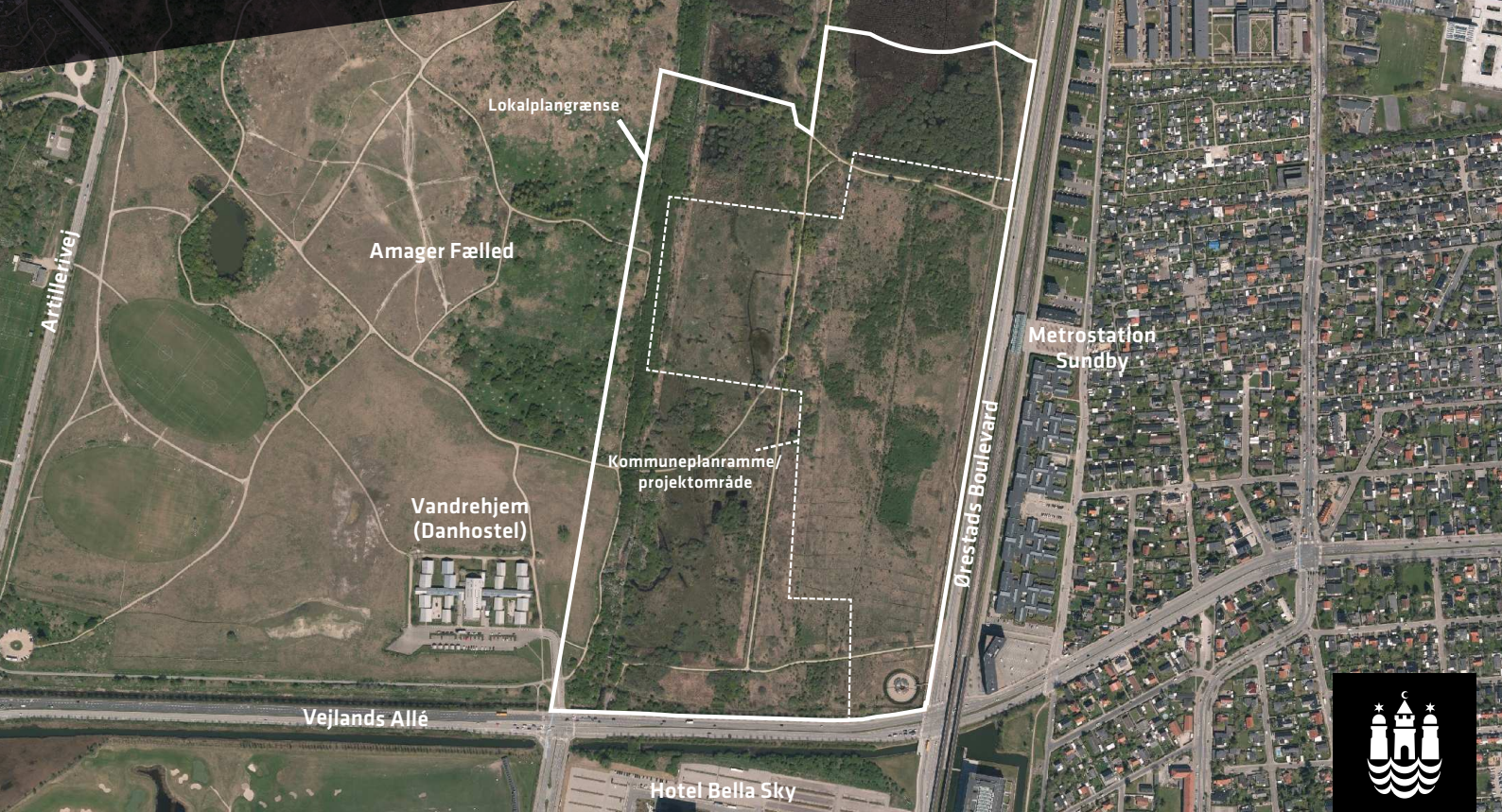
Luftfoto af området

Principper for udarbejdelse af forslag til lokalplan Ørestad Fælled Kvarter med tilhørende forslag til kommuneplantillæg