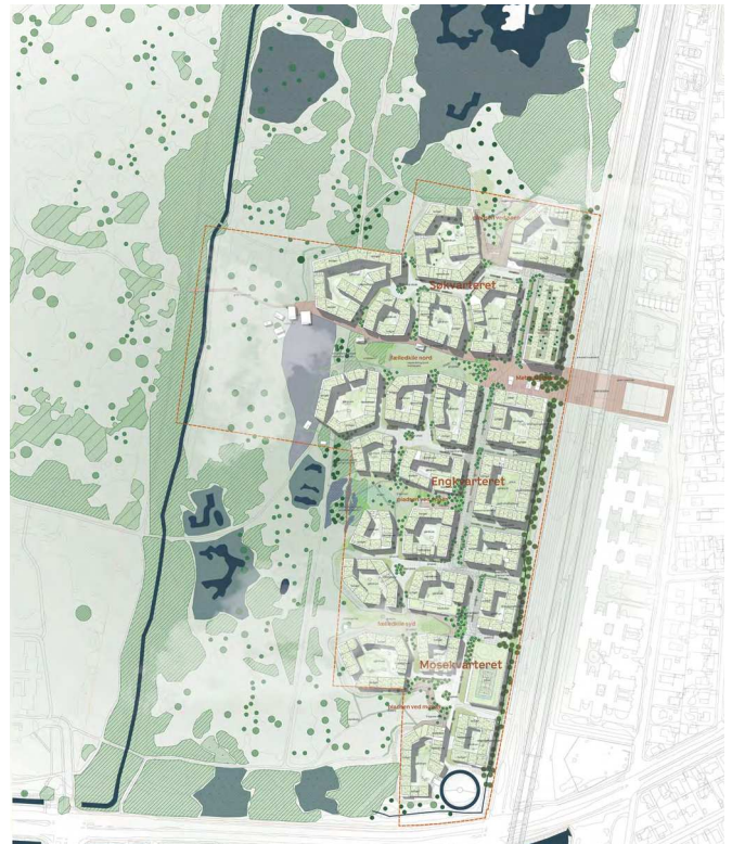
Masterplan udarbejdet af tegnestuen Vandkunsten og Marianne Levinsen Landskab

Området består af overdrev, moser, enge, søer og rørskov og dele af den oprindelige strandeng. Der er et varieret plante- og dyreliv. Inden for projektområdet er der regi-