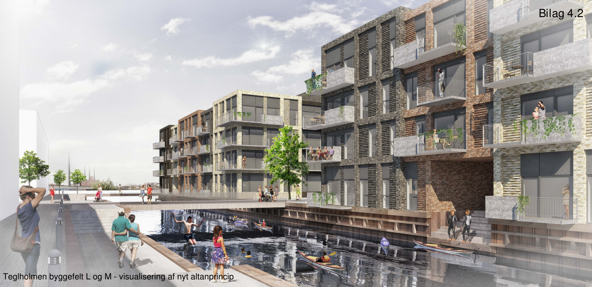
Teglholmen byggefelt L og M - visualisering af nyt altanprincip