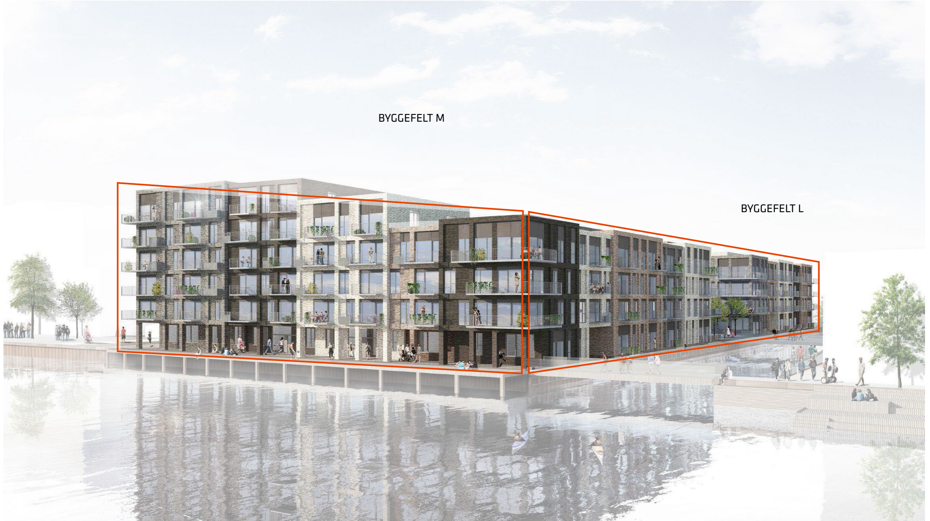
Teglholmen byggefelt L og M - afgrænsning af facader med forøget altandybde