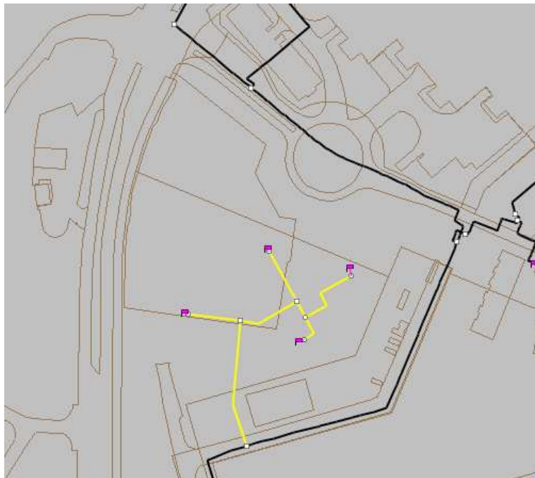
Figur 3 Udbygget ledningsnet for Fisketorvet

En skitse over fjernvarmenettets placering i området er vist i figur 3. Det nøjagtige tracé kan blive ændret i takt med, at planerne for bygningernes placering bliver endelige. Ud over gadeledningen skal der etableres stikledninger ind til hver bygning.