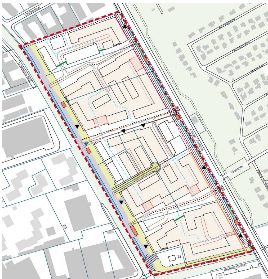
Figur 5. Fremtidig trafikstruktur

Samlet vurderes det, at trafikken til og fra området kan afvikles uden store konsekvenser for det omkringliggende byområde, med den valgte løsning og et nyt signalreguleret kryds på Prags Boulevard. Samtidig friholdes selve området i meget høj grad for trafik, således, at der skabes et fredeligt område, med grønne kiler med god forbindelse til de omkringliggende områder. Det er desuden vurderet, at støj som følge af eventuel øget trafik til området ikke vil være væsentlig.