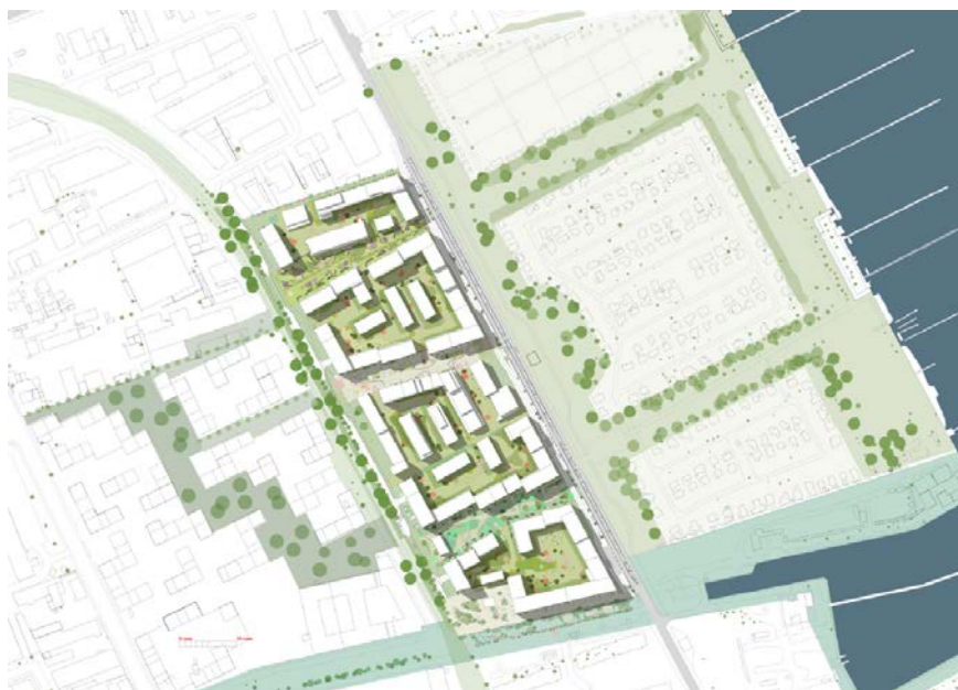
Figur 1. Overordnet situationsplan for lokalplanområdet.

Området forventes at blive udbygget over flere år og af forskellige bygherrer. Derfor indeholder lokalplanforslaget bestemmelser, som skal sikre sammenhæng i nybyggeriets arkitektoniske udtryk.