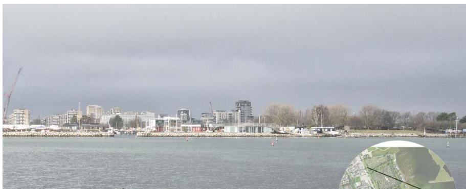
Den eksisterende bebyggelse set fra Amager Strandpark. Ill. af Tegnestuen Vandkunsten.