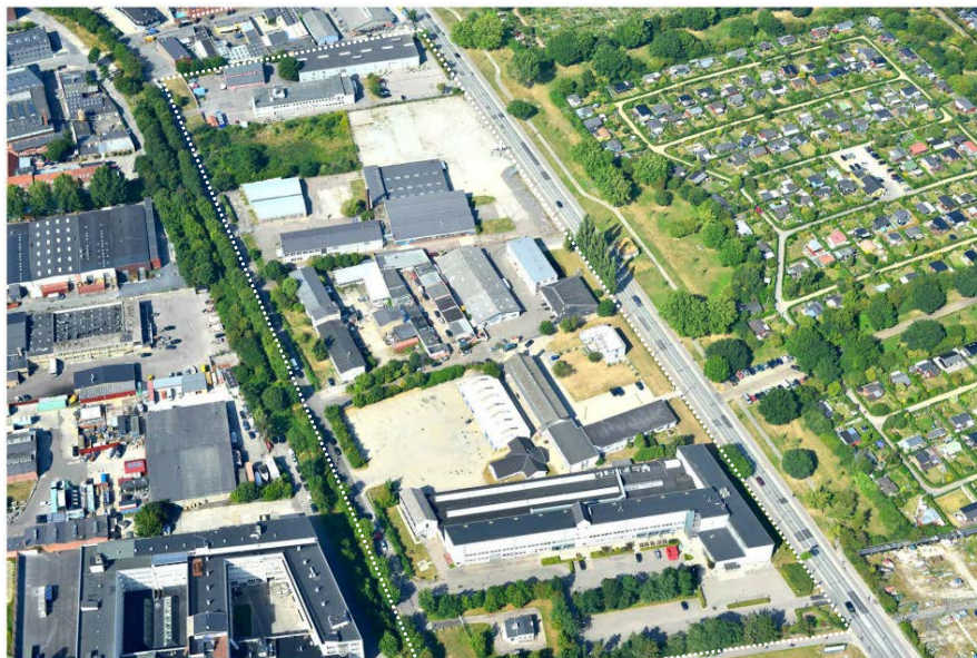
Luftfoto af lokalplanområdet

Lokalplanen skal muliggøre bestemmelser for et nyt bykvarter beliggende mellem Amager Strandvej og den sydlige del af Ved Amagerbanen. Kommuneplanrammen er C2 med en bebyggelsesprocent på 150 med bestemmelse om, at boligandelen kan være op til 80 % af etagearealet, hvilket muliggør op til knap 94.000 m 2 boliger og erhverv.