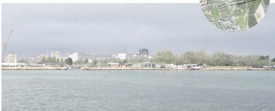
Den eksisterende bebyggelse set fra Amager Strandpark med indtegning af nybyggerierne. Ill. af Tegnestuen Vandkunsten.