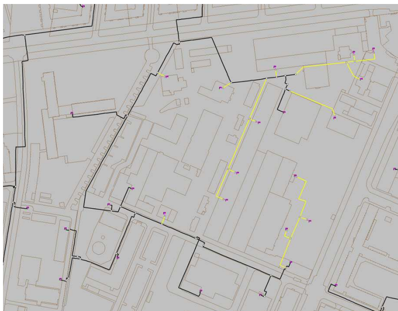
Figur 2 Udbygget ledningsnet for F.L. Smidth-området

En skitse over fjernvarmenettets placering i området er vist i figur 3. Det nøjagtige tracé kan blive ændret i takt med, at planerne for bygningernes placering bliver endelige. Ud over gadeledningen skal der etableres stikledninger ind til hver bygning.