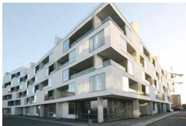
Referencefoto: Nordlyset (boliger), Amerika Plads, København. Illustration: Skovhusarkitekter.