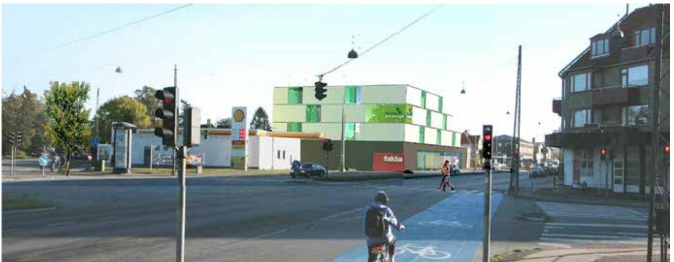
Roskildevej med den nye bygning med opbevaringscenter og dagligvarebutik. Illustration: Skovhusarkitekter.