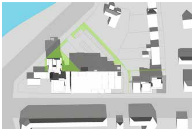
21. marts kl. 12.00