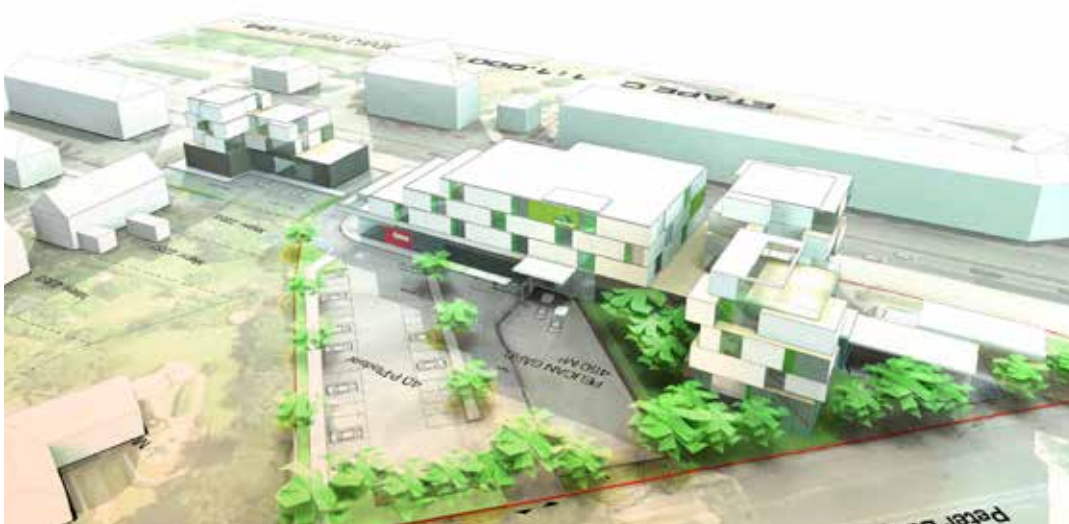
Visualisering af bebyggelsen og parkeringsområdet med opbevaringscenteret i midten. Illustration: Skovhusarkitekter.