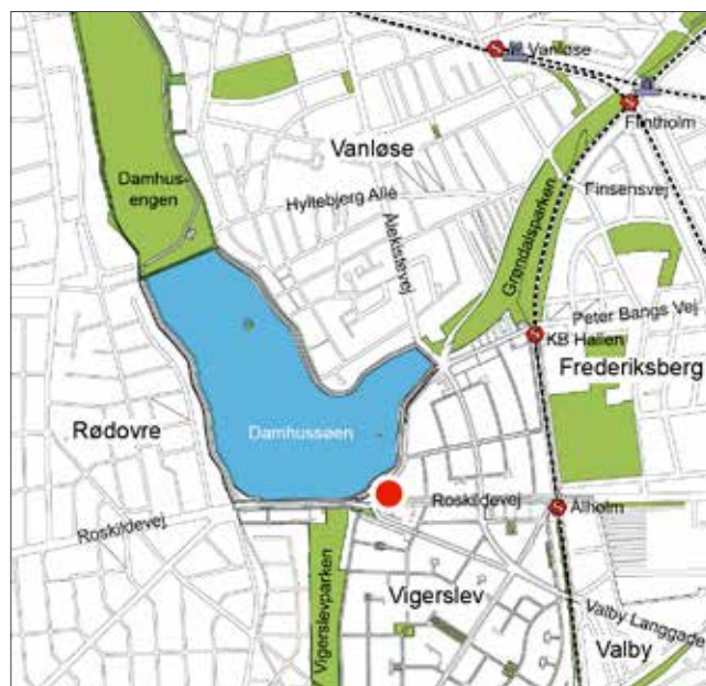
Lokalplanområdet, der er vist med en rød prik, ligger i bydelen Valby.

Lokalplanområdet har en markant placering ved Damhussøen, og hjørnet mellem Roskildevej og Peter Bangs Vej fungerer som port til bydelen og København. Der vil