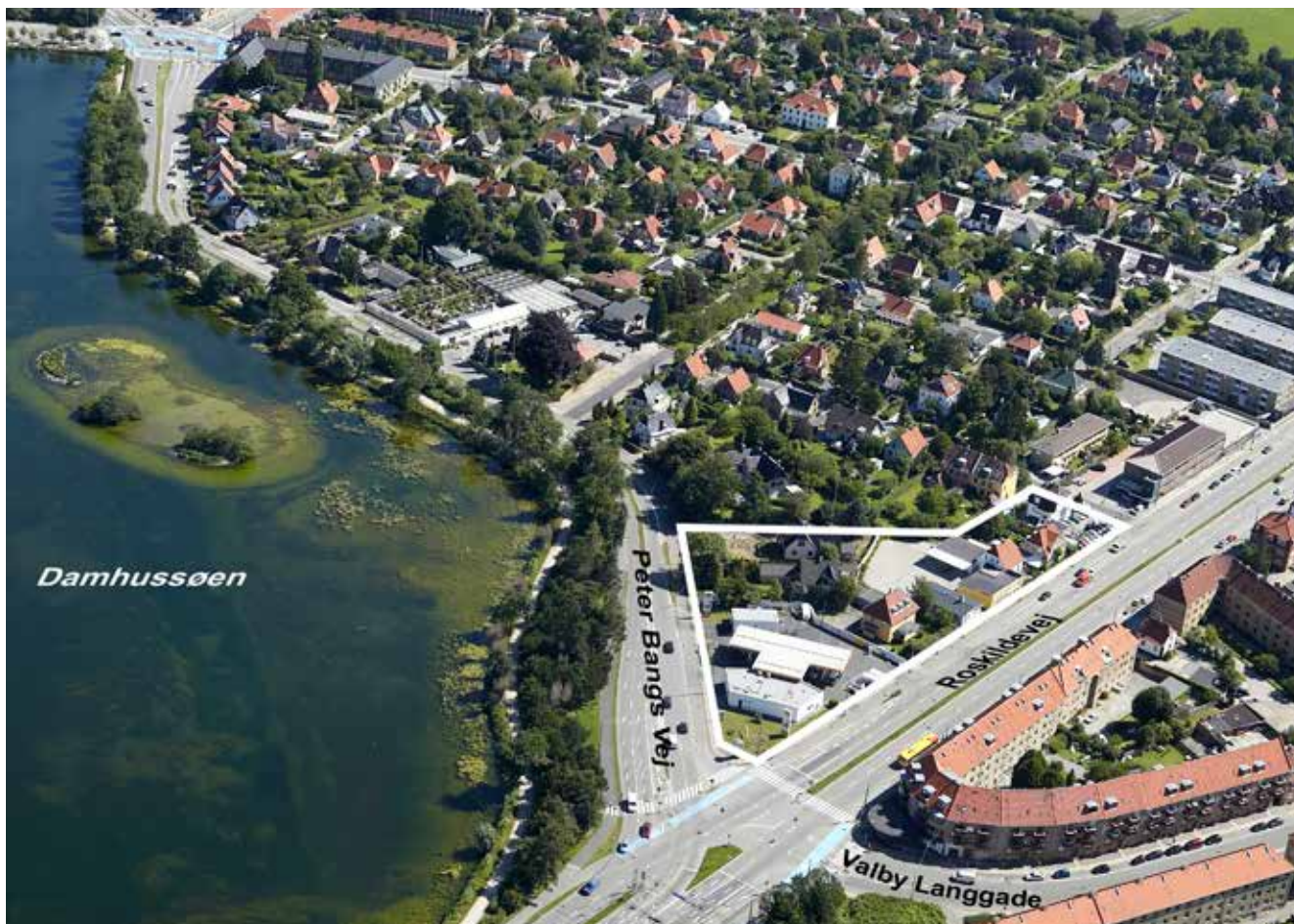
Luftfoto af området med angivelse af lokalplanområdet med hvid bræmme ( JW luftfoto, Juli 2012).