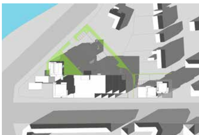
21. marts kl. 16.00