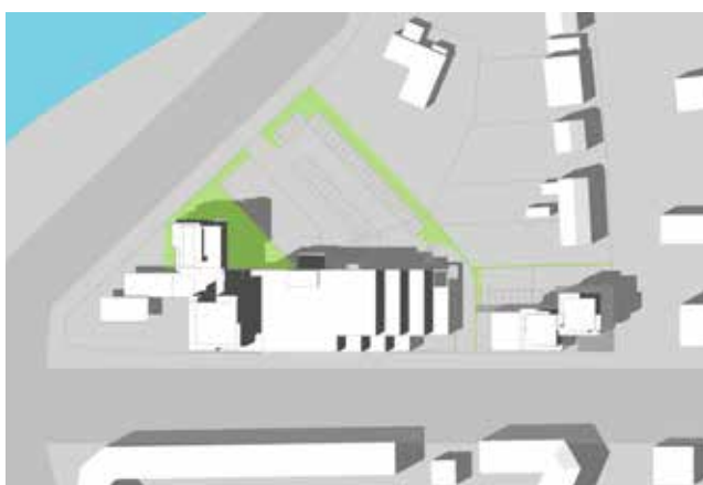
21. juni kl. 16.00