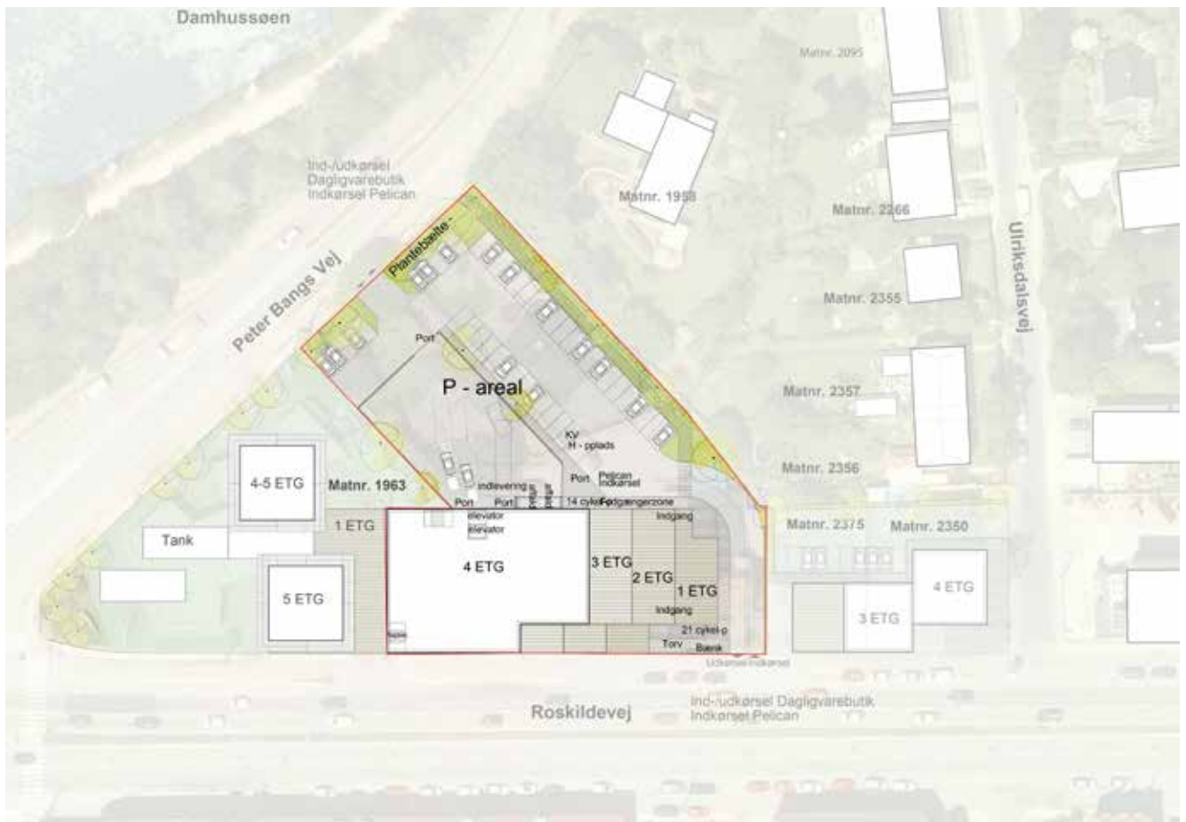
Situationsplanen viser den nye bebyggelse og indretningen af parkeringsområdet. Illustration: Skovhusarkitekter.

Projektet indeholder en bygning på ca. 4.500 m 2 eta-gear. Det svarer til en bebyggelsesprocent på 110. Friarealprocenten vil være 15, da der er tale om serviceerhverv. Bygningen er projekteret således, at den udover anvendelse til opbevaringscenter alternativt kan indrettes til kontor.