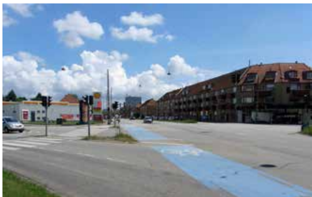
Krydset Roskildevej og Peter Bangs Vej med tankstationen til venstre og den gule karrébebyggelse på 3-3½ etage til højre i billedet.

Lokalplanområdet er biltrafikalt velbeliggende, og der er cykelstier langs Roskildevej og Peter Bangs Vej. Der kan køres ind til opbevaringscentret og dagligvarebutikken fra både Roskildevej og Peter Bangs Vej. På grund af en