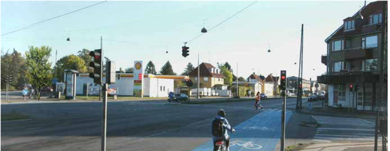
Roskildevej som den ser ud i dag. Illustration: Skovhusarkitekter.