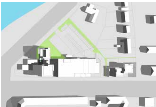
21. juni kl. 9.00