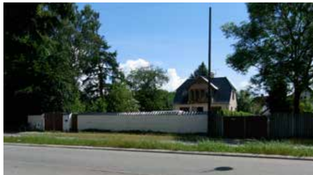
De to ejendomme ud mod Peter Bangs Vej der vil blive overført til serviceerhverv.

I lokalplanen fastlægges desuden antallet af parkeringspladser, og deres placering, samt bestemmelser for