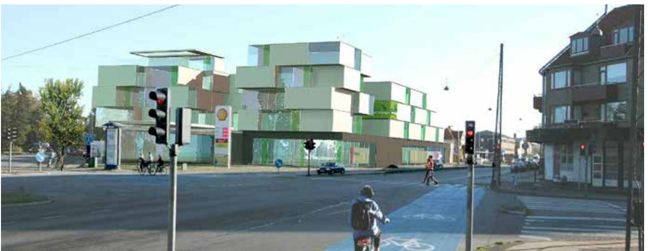
Roskildevej med den nye bygning og idéskitse til, hvordan tankstationen kan integreres i erhverv/bolig. Illustration: Skovhusarkitekter.