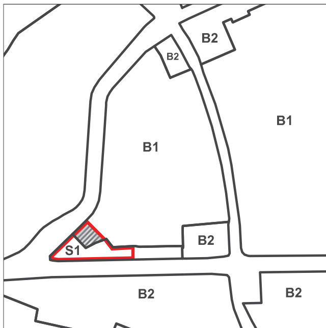
Eksisterende rammebestemmelser i Kommuneplan 2011.

I Kommuneplan 2011 er den del af lokalplanområdet der ligger mod Roskildevej fastlagt til et S1-område til (serviceerhverv) og den del der ligger mod Peter Bangs Vej er fastlagt til B1-område (boliger).