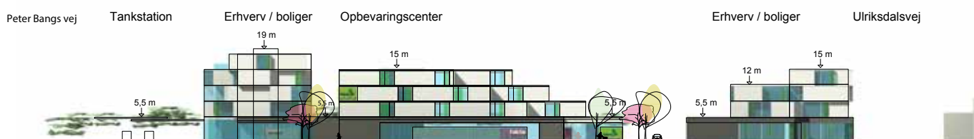
Facader set fra Roskildevej (syd). Illustration: Skovhusarkitekter.

På hjørnet af Roskildevej og Peter Bangs Vej giver planen mulighed for at genhuse benzintanken i en mere urban bebyggelsesstruktur, samt for at etablere serviceerhverv og eventuelt boliger. Byggeriet kan være op til 20 m højt. På de to ejendomme nærmest Ulriksdalsvej er der ligeledes mulighed for at etablere serviceerhverv og eventuelt boliger. Byggeriet kan være op til 15 m i højden.