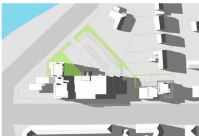
21. juni kl. 19.00

Skyggediagrammerne viser, at den omkringliggende bebyggelse kun i begrænset omfang vil blive berørt af skygge fra de kommende byggerier.