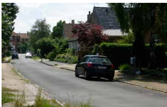
Ulrikdalvej set fra Langvaddam ned mod Roskildevej.

Damhussøen er et stærkt landskabsэлемент, der fungerer som et stort rekreativt område. Langvaddams villakvarter udgør et homogent område med varierende, større villaer fra 1910-20'erne. Området fremstår med grønne vejforløb, der spreder sig i en vifte fra Langvaddam. Syd for Roskildevej, umiddelbart over for lokalplanområdet, ligger en arkitektonisk homogen karrébebyggelse i 3-3½ etage opført omkring år 1930-40. Karréen mod Roskildevej er opført i gule mursten med røde tegltage.