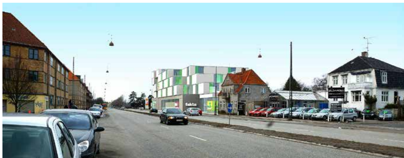
Visualisering af den nye bebyggelse set fra sydøst op af Roskildevej. Illustration: Skovhusarkitekter.