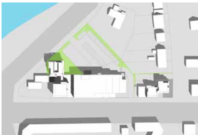
21. juni kl. 12.00