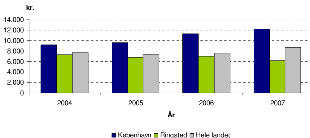
Figur: Udviklingen i kommunale udgifter pr. sygedagpengeforløb, 2004-2007

Ringsted Kommune har – som en af ganske få kommuner – formået at afkorte sagsvarigheden på sygedagpengeområdet. Ringsted har således nedbragt sine udgifter pr. sygedagpengeforløb fra 7.300 i 2004 til ca. 6.200 kr. pr. sygedagpengeforløb i 2007 og ligger væsentligt under landsgennemsnittet, der var på 8.600 kr. pr. sygedagpengeforløb i 2007. I København er udgifterne steget fra ca. 9.200 kr. i 2004 til ca. 12.200 kr. i 2007.