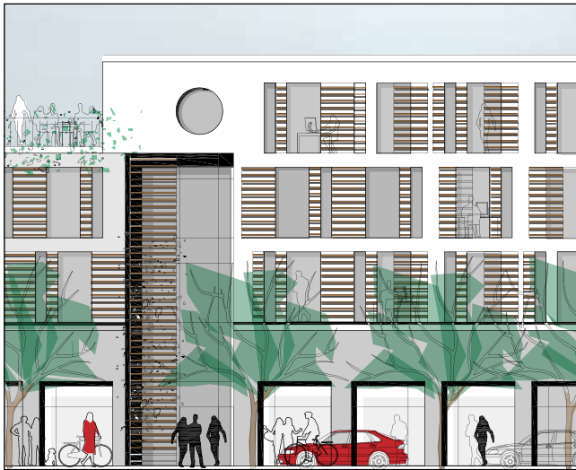
Princip facadeudsnit mod Godthåbsvej