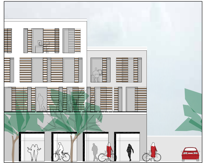
Princip facadeudsnit mod Frederiksgårds Allé

Denne naboorientering beskriver ændringerne i projektet/lokalplanen. Der sker følgende ændringer: