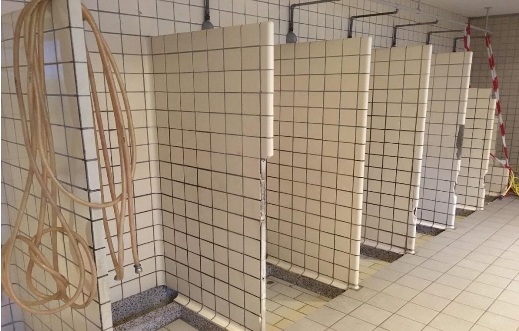
Foto 4 Drenges toilet