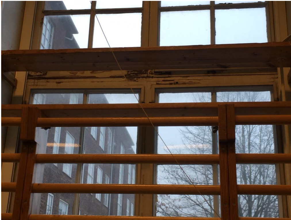
Foto 8 Drenges omklædning