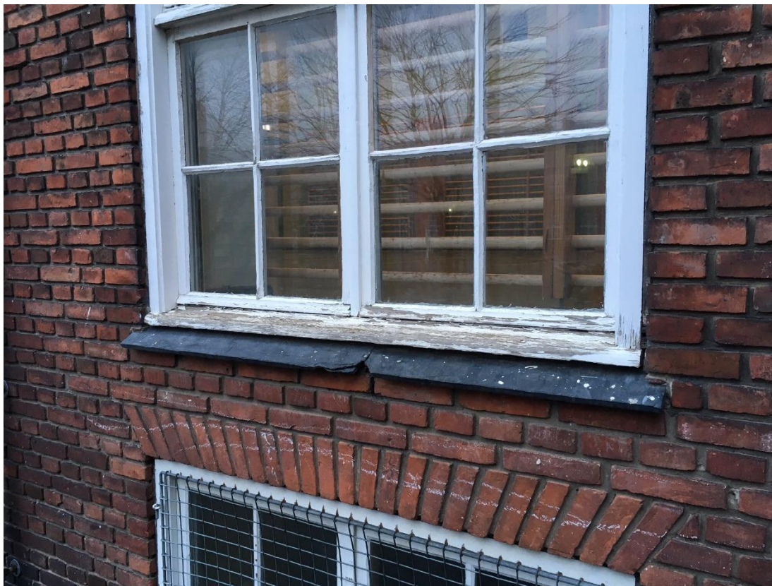
Foto 2 Rådden bundkarm