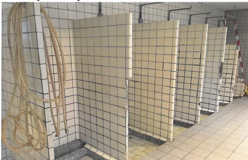
Foto 4 Drenges toilet