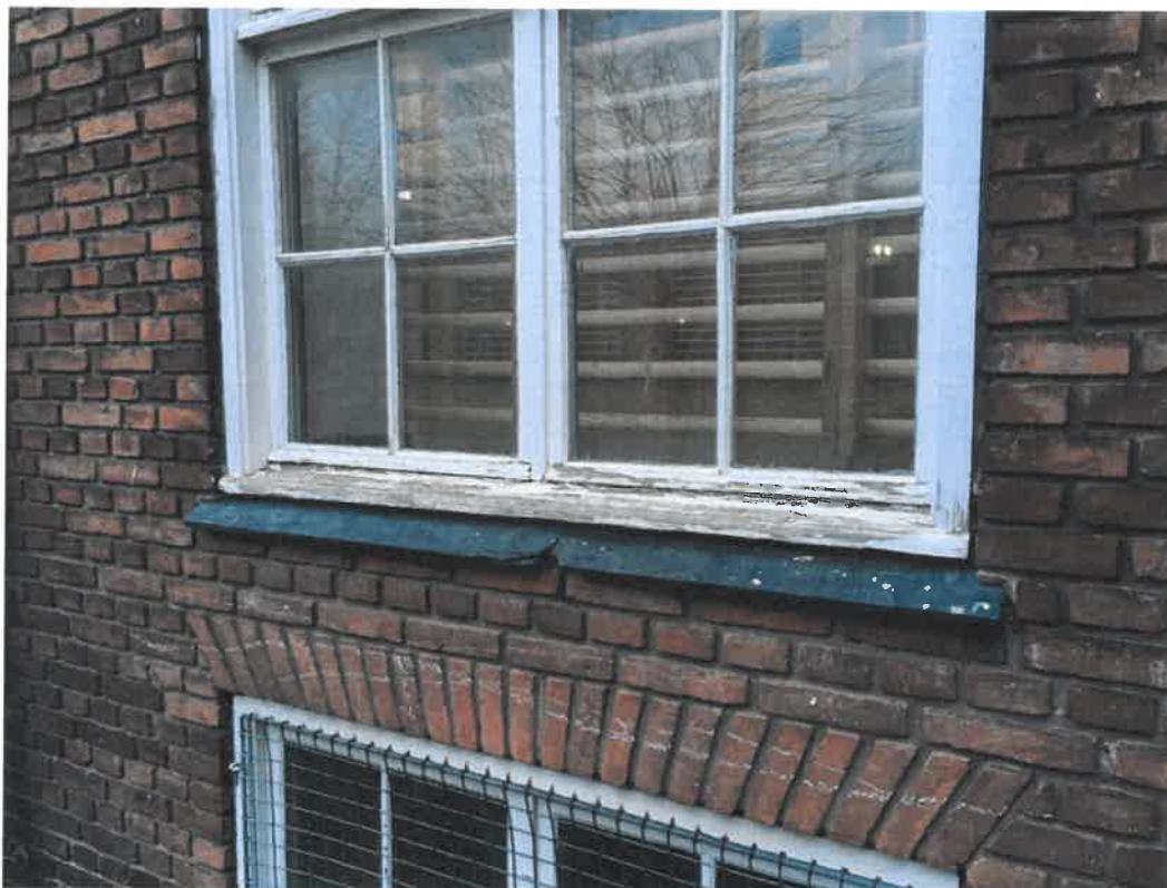
Foto 2 Rådden bundkarm