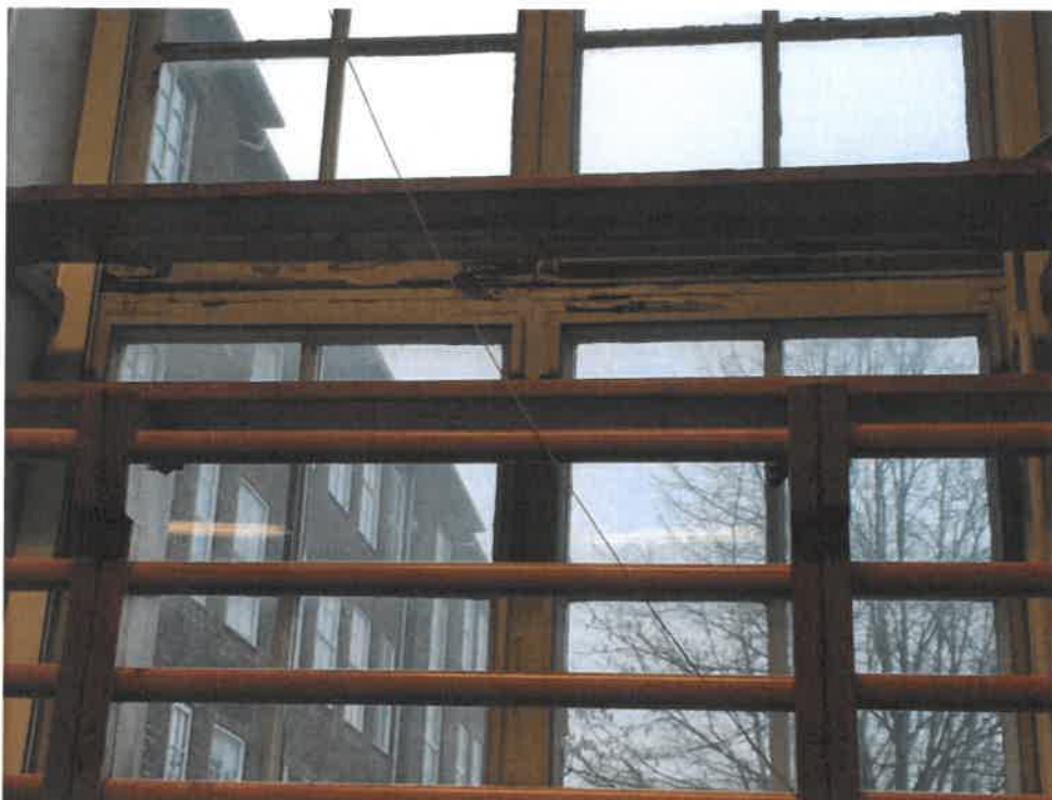
Foto 8 Drenges omklædning