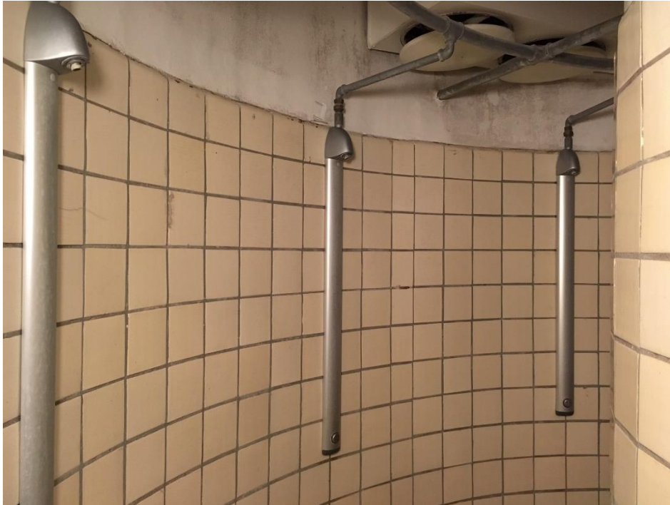
Foto 6. Drenges bad. Rådvent vindue