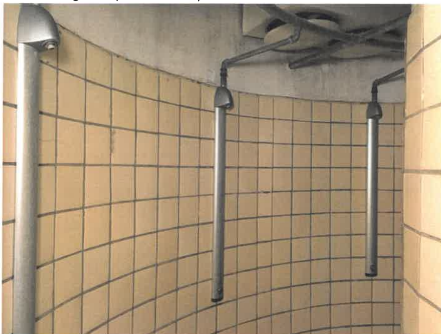
Foto 6. Drenges bad. Rådvent vindue