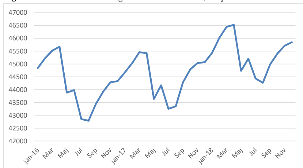
Figur 1: Antal indmeldte i daginstitutioner målt i børnepoint*

*Antallet af indmeldte er omregnet til børnepoint, hvor et vuggestuebarn svarer til to point og et børnehavebarn til et point