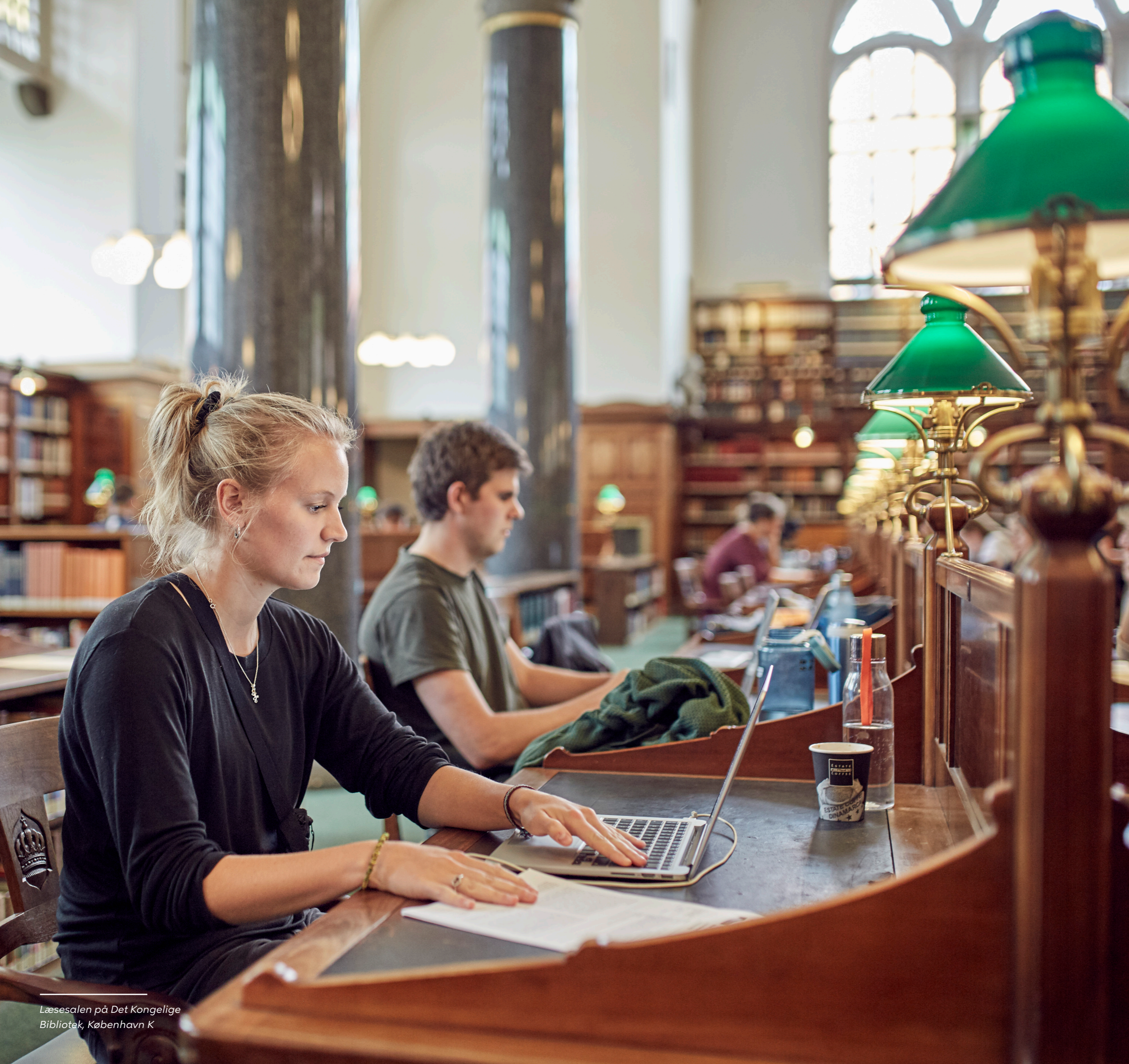
Læsesalen på Det Kongelige Bibliotek, København K