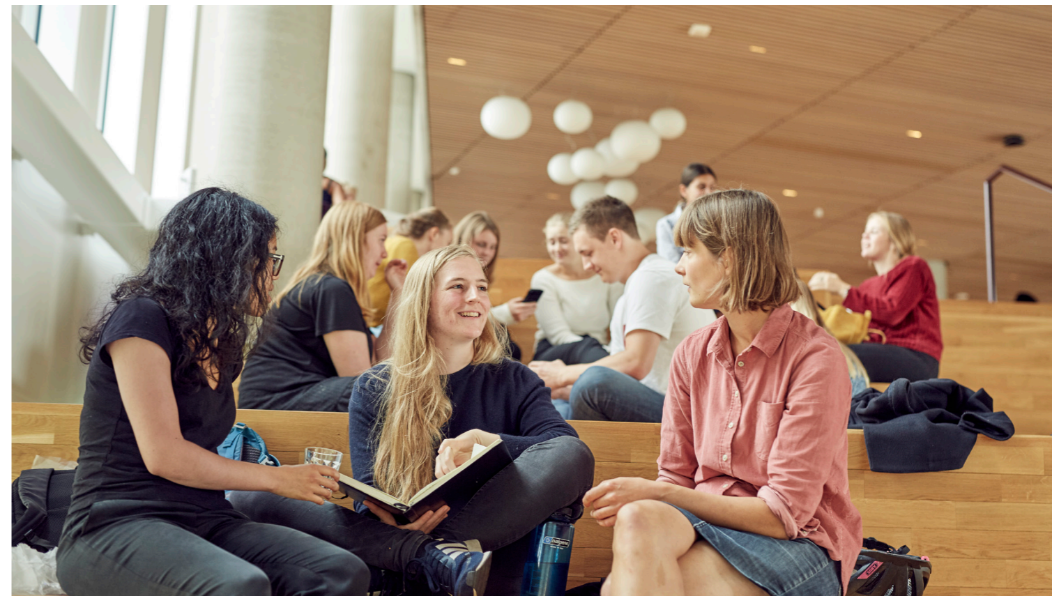
Panum, Københavns Universitet på Nørrebro