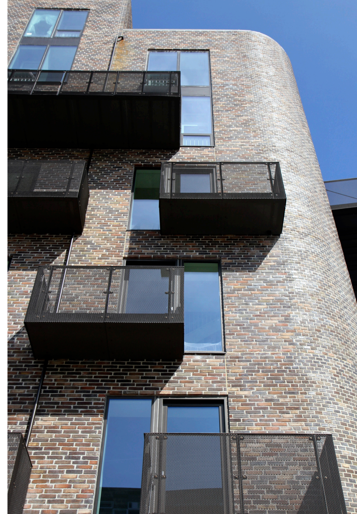
Faste Batteri, almene ungdomsboliger på Islands Brygge

I det videre arbejde med anbefalingerne i politikken for København som studieby skal bæredygtighed således også indgå i alle sammenhænge, hvor det giver mening. Det gælder ikke mindst i forbindelse med anbefalingerne på boligområdet, hvor der skal arbejdes for, at boliger og boligområder etableres med bæredygtighed og klimahensyn for øje.