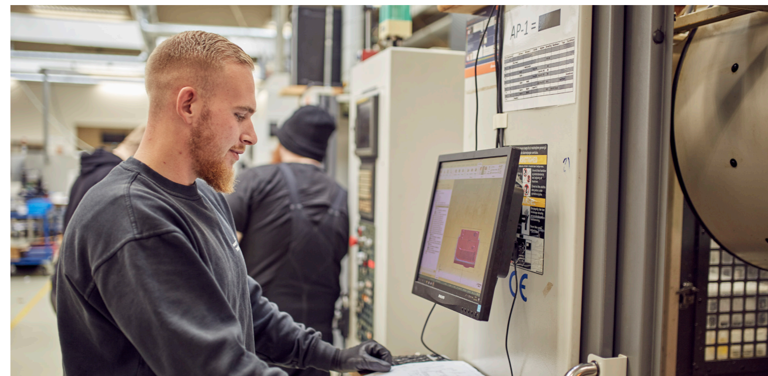
Værkstederne på erhvervsuddannelserne NEXT i Emdrup.

Fortsat fokus på et tæt samarbejde mellem uddannelsessteder, virksomheder og kommunen om indsatser som kvalificerer de studerende til jobs efter endt uddannelse.