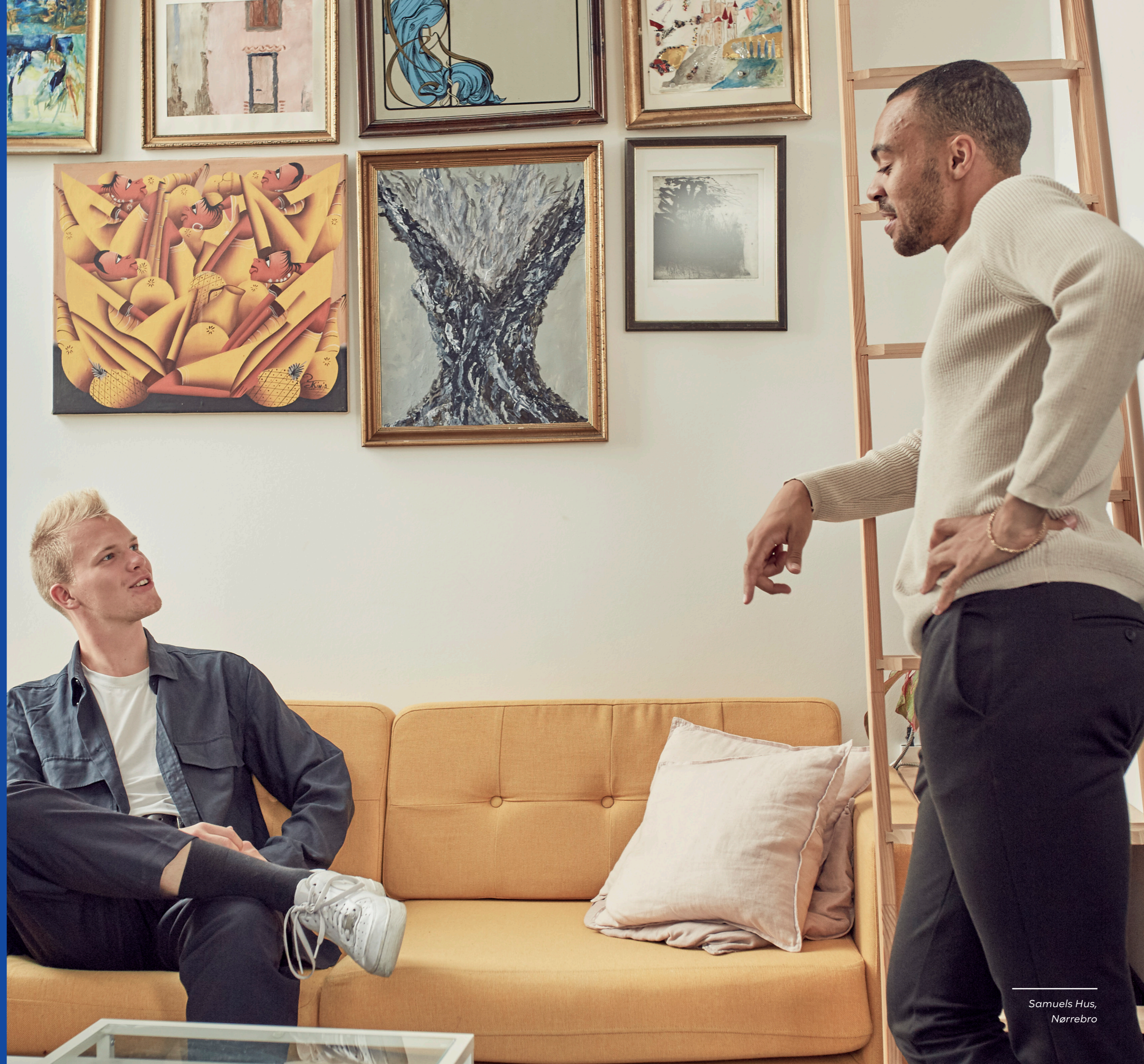
Samuels Hus, Nørrebro

Nordbro er et nyt privat ungdomsboligbyggeri på ydre Nørrebro. Der er i alt 388 studielejligheder og 122 3- og 4-værelses lejligheder, der både er egnet som familieboliger eller bofællesskaber med plads til fx 2-3 studerende. Bebyggelsen bindes sammen af en grøn gårdhave. Fra taghaven har alle beboere adgang til et fælleshus med bar.