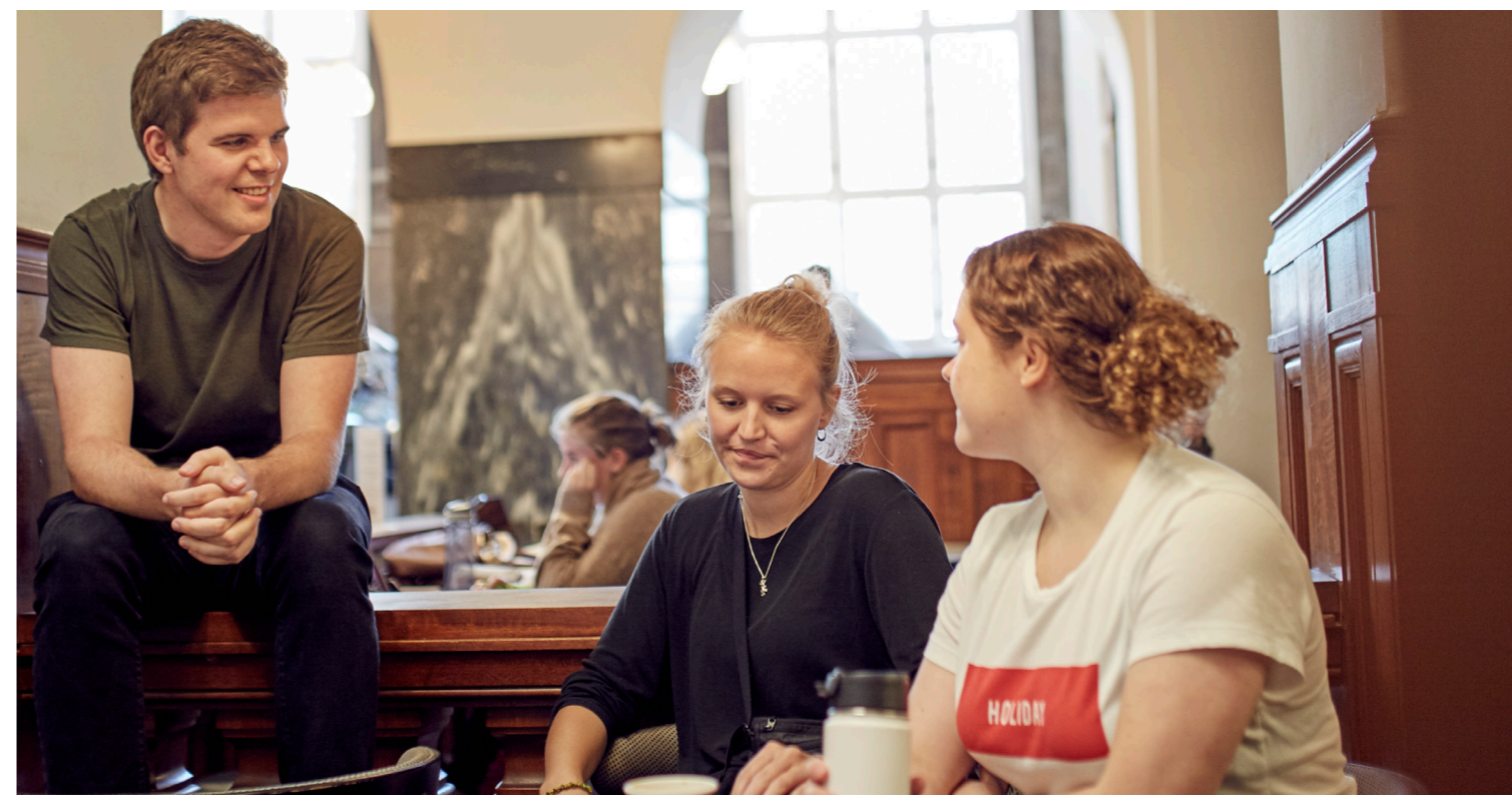
Læsesalen på Det Kongelige Bibliotek i København K

Flere studerende skal bidrage til en levende og blandet by