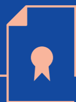
02 Job Overgang til arbejdslivet