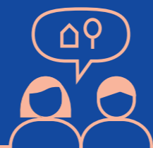
03 Deltagelse Bidrag til byen