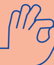
05 Trivsel Fællesskab i studielivet