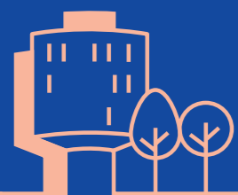
01 Boliger Boliger til studerende