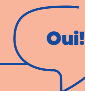
06 Internationale studerende Internationale talenter

Studielivspolitikken viser Københavns Kommunes vision for København som studieby. Både hvor vi gerne vil hen, men også hvad der skal til for at nå målet. Det gode studieliv handler om tryghed, trivsel, personlig udvikling, demokratisk dannelse og om at blive klar til at træde ind på arbejdsmarkedet.