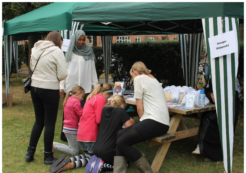
Miljøambassadørerne er ude og fortælle om affald.

Indsatsen i Sundholmskvarteret skal i særlig grad ses i relation til, at mange miljøambassadørerne bor i Sundholmskvarteret, og at det var herfra de første Miljøambassadørerkurser blev arrangeret tilbage i 2006. Se mere om aktivitetdagen under afsnittet om "Affaldssortering".