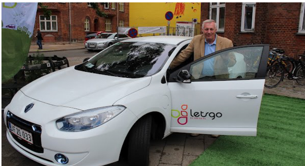
Transportminister Henrik Dam prøver en el-bil fra delebilsordningen.

Målsætningerne for indsatsområder er kun delvist opfyldt. Der har i løbet af 2012 været afholdt og igangsat væsentlige initiativer, men vi må også se i øjnene, at indsatsen kunne have haft større gennemslagskraft. Vi håber, at aftalerne med foreningen LetsGo i 2013 vil kunne give anledning til konkrete deleordninger i samarbejde med lokale boligforeninger.