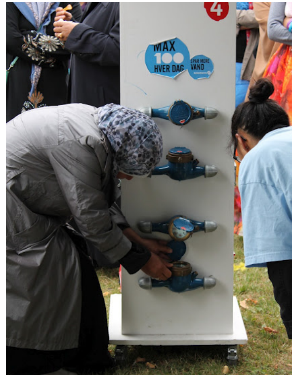
Konkurrence med fokus på ressourcer.

Sidst på året fik 25 miljøambassadører mulighed for at opdatere deres viden om affaldssortering og de nye sorteringsbeholdere i Københavns Kommune.