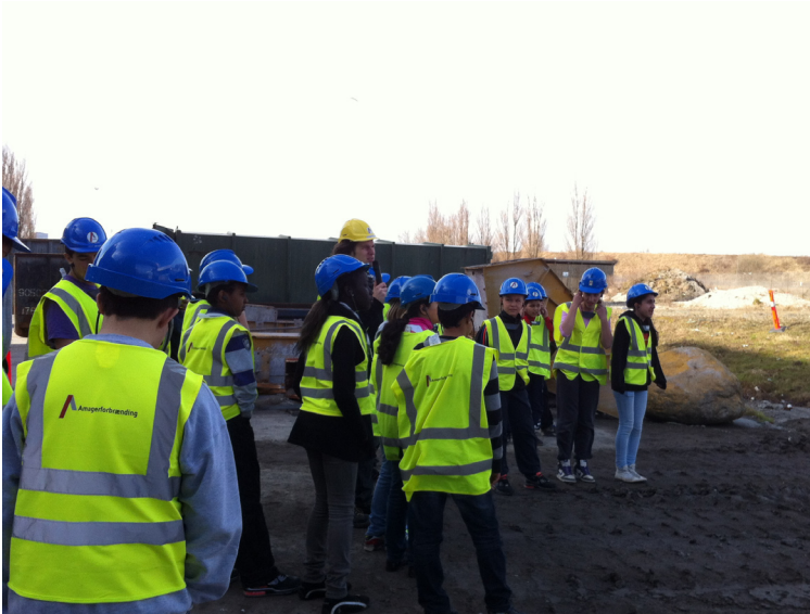
Udflugt til Amager Forbrænding.

Indsatsen for øget sortering og korrekt håndtering af affald, har været centreret i Amager Vest. Igennem årets løb, er der blevet afholdt en række aktiviteter, der har sat fokus på de ressourcer, der kan hentes i affaldet.