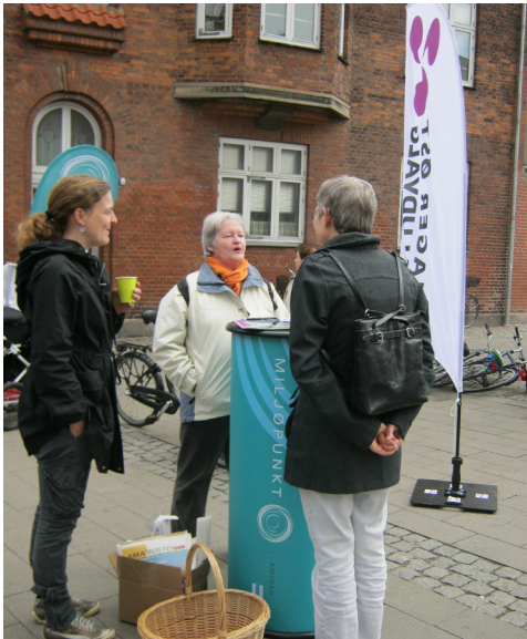
Lokaludvalg Amager Øst til miljøfestival.

Miljøpunkt Amager har samarbejdet med Amager Øst Lokaludvalg om udarbejdelsen af den kommende bydelsplan for Amager Øst. Projekterne i bydelsplanen blev udarbejdet i løbet af foråret og sommeren, og selve bydelsplanen lå endeligt klar i oktober. Miljøpunktets rolle var at formulere bydelsplanens strategi for de grønne områder. Disse endte med at udgøre størstedelen af bydelsplanen. Projekterne afventer nu politisk behandling i Københavns Borgerrepræsentation, der skal tage stilling til hvilke projekter, der skal realiseres og hvornår. Som et særligt projektområde har klimatilpasning været udarbejdet i et samarbejde mellem Amager Øst Lokaludvalg og Amager Vest Lokaludvalg.