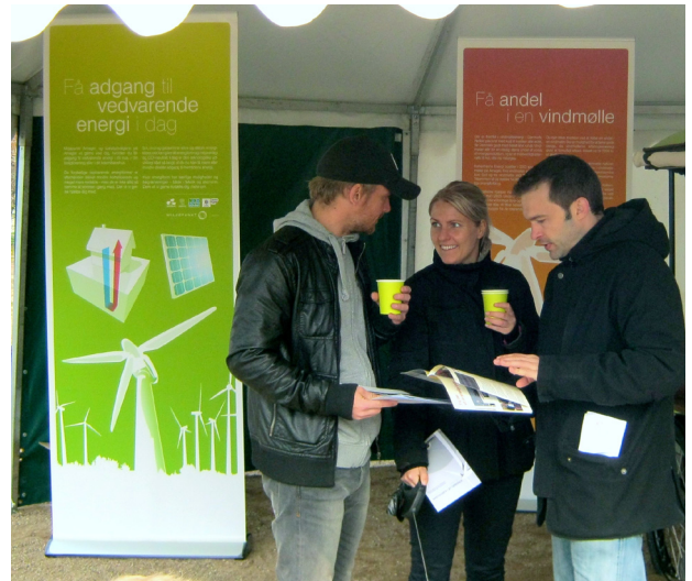
Spørgsmål blev klaret over en kop kaffe.

Temaerne var solenergi, vindkraft og geotermisk energi. De til lejligheden producerede informations-skærme vil også fremover kunne anvendes til informationskampagner om vedvarende energi.