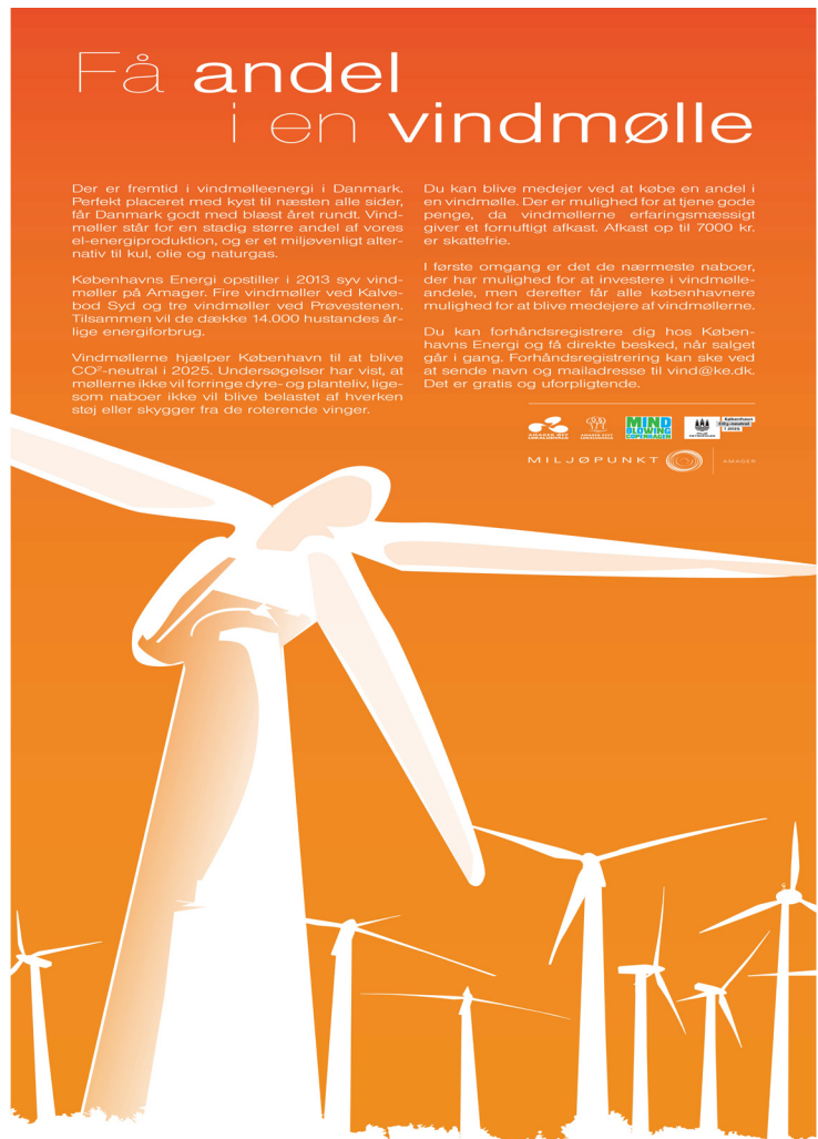
Planche fra miljøfestivalen om vindmølleandele.

Og samtidig kan det reducere miljøet for en unødvendig påvirkning, når de ekstra tons CO 2 farer ud i atmosfæren. Miljøpunkt Amager var lokal formidler for kampagnen bl.a. gennem hjemmeside, facebook og uddeling af foldere. Se mere på sommerluk.dk .