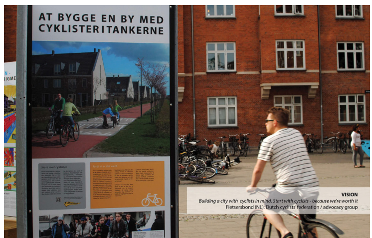
Udstillingen tiltrak både lokale og turister.

Et af de store vidensprojekter i 2012 var udstillingen The Good City . I samarbejde med 18 nationale og internationale bidragsydere tog Bicycle Innovation Lab udgangspunkt i Københavns potentiale som international foregangsby og præsenterede en række visioner for Københavns fremtid som en by, hvor bæredygtighed og cykelkultur går hånd i hånd. Målet var at skabe et fælles rum for debat og nytænkning af cyklens rolle i fremtidens København.