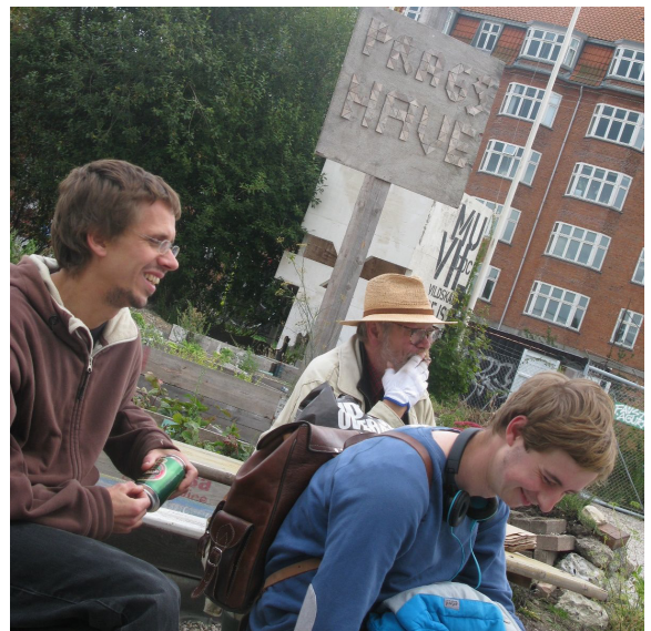
Sommerfest i Prags Have.

I løbet af 2012 er der også blevet afholdt to sammenkomster med fagligt indhold efterfulgt af festmiddag. Hver måned holdes der desuden et møde mellem lederne af de københavnske miljøpunkter.