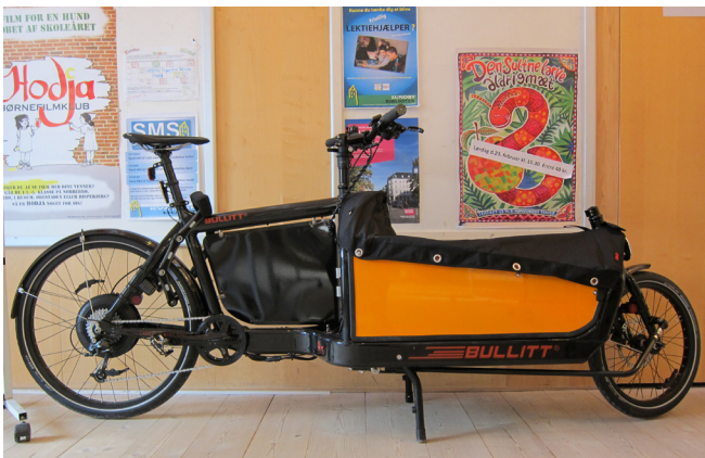
De nye elladcykler kommer let rundt på cykelstierne.

Fra Miljøpunkt Amager der har været udlånt ladcykel ca. 75 dage i løbet af året. Amager Vest Lokaludvalg har desuden finansieret fem ladcykler, som er blevet placeret hos forskellige samarbejdspartnere i Amager Vest (Fields, Kulturhuset Islands Brygge og Partnerskabet Urbanplanen). Amager Øst Lokaludvalg har tillige finansieret 3 elcykler, som er blevet udlånt fra cykelbiblioteket i Bicycle Innovation Lab på Prags Boulevard. Således er det ikke længere kun fra Miljøpunkt Amagers kontor på Jemtelandsgade, at der kan lånes ladcykler. Det kan nu lade sig gøre på det meste af Amager. For at holde alle disse cykler vedlige, har Miljøpunkt Amager fra december 2012 ansat en cykelmekaniker en dag om ugen.