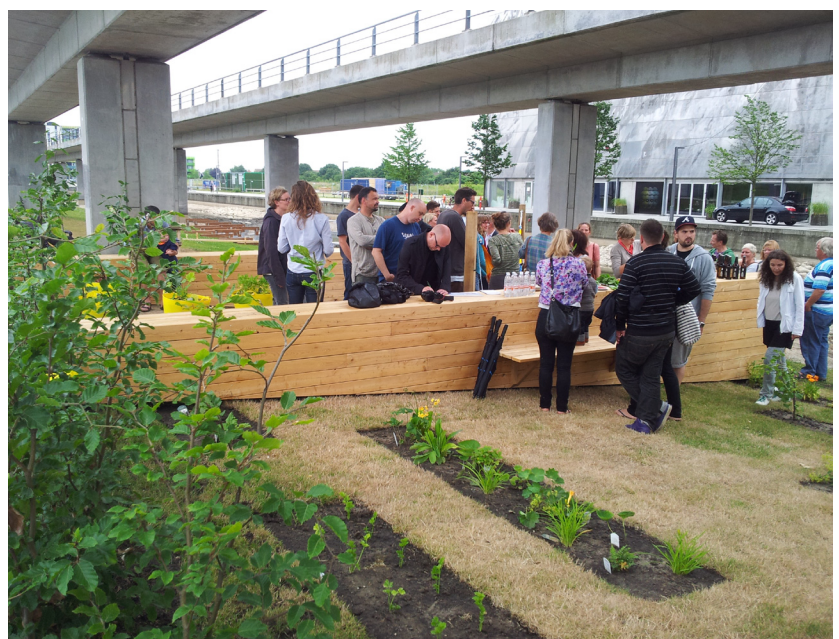
Der mødte mange interesserede havebrugere op til åbningen af Metrohaverne.

De to prøvehaver skal i forsøgsperioden anvendes til at undersøge, om der kan dyrkes nytte- og prydsplanter under de særlige forhold metroen giver. Godt 50 frivillige har allerede tilkendegivet deres interesse i at få del i haverne, hvis forsøget lykkes.