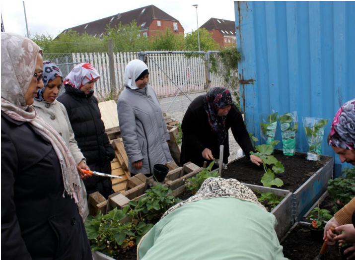
Miljøambassadørerne planter i havekasserne.

En væsentlig værdi ved kurset, har desuden været muligheden for at inspirere miljøambassadørerne til at arbejde med byhaver, samtidig med at se det som en mulighed for at få adgang til sundere mad.