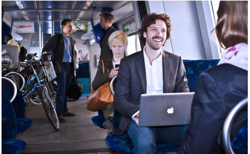
KørSmart opfordrer til grønnere transportvaner.

Netværket har fokus på udfordringer på transportområdet og arbejder med Mobility Management-løsninger, der har mindre trængsel og mindre udledning af CO2 som endemål.