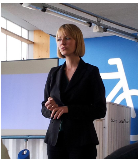
Besøg af Miljøminister Ida Auken.

I foråret blev der afholdt et årsmøde i Agenda 21 netværket, hvor vi blandt andet havde besøg af miljøminister Ida Auken.