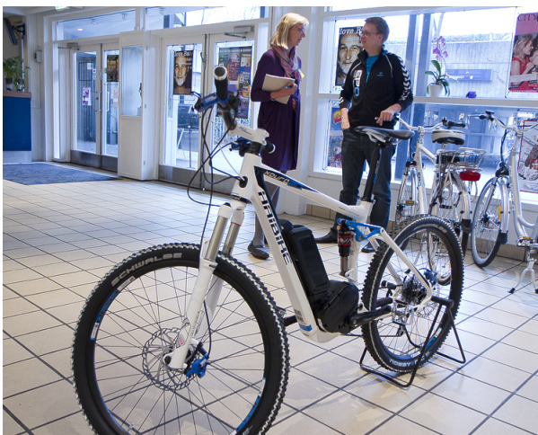
Transportnetværket Amager når ca. 1300 ansatte.

Femte netværksmøde blev afholdt den 16. januar 2013 hos Steen & Strøm. Netværket havde valgt Cykelparkering som emne og Steen & Strøms udfordringer omkring etableringen af cykelparkering ved Fields i Ørestaden blev brugt som case med oplæg fra Steen & Strøm, Københavns Kommune og Bicycle Innovation Lab. Næste netværksmøde er planlagt den 8. maj 2013 med fokus på de nye pendler cykler og mobilitetsplaner i virksomheder.