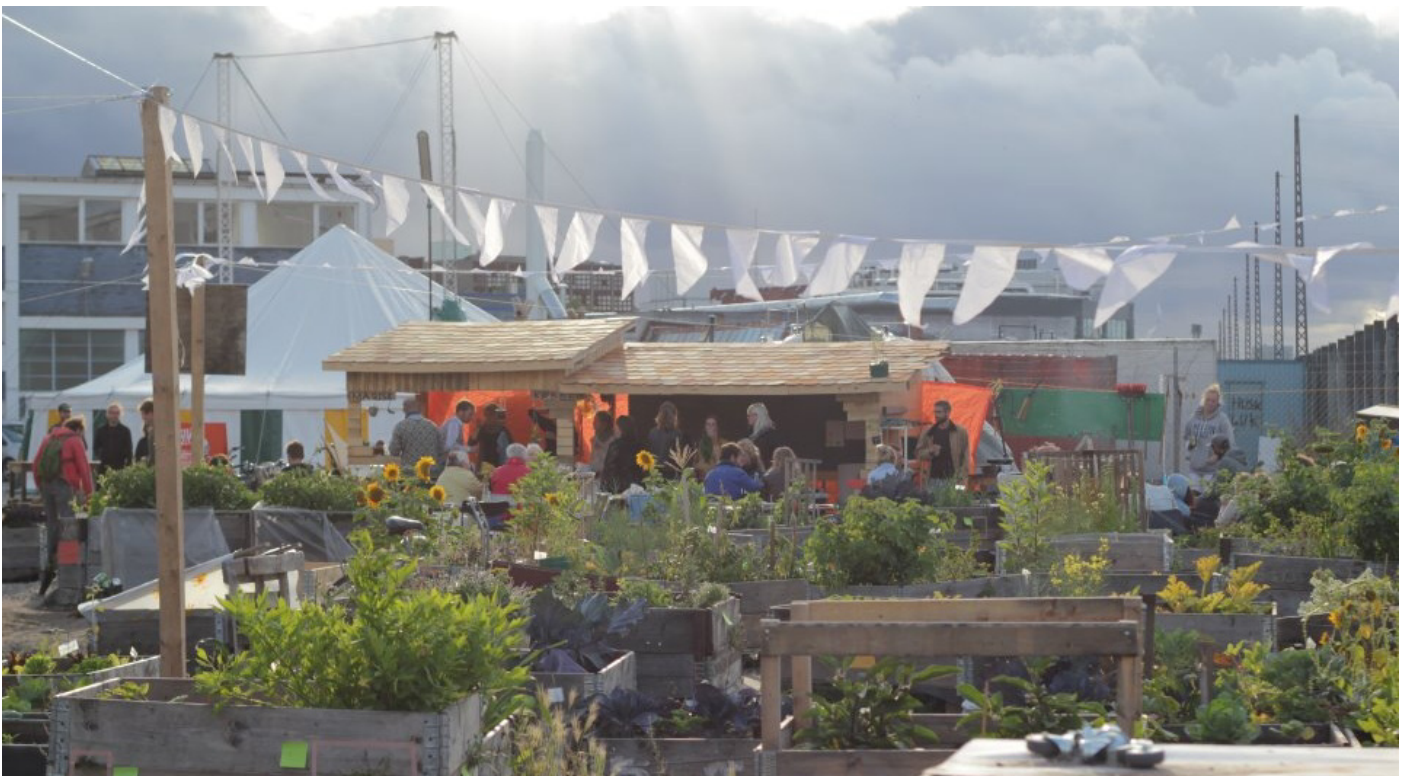
Prags Have holdt også denne sommer hyggelige fællesspisninger med afgrøder fra haven.

Arbejdet med at gøre Amager til "Grøn bydel" har i 2012 været bredt og varieret. Vi har haft mange aktiviteter og været involveret i en række lokale byhaveprojekter. Alligevel må vi konkludere at målsætningerne for området kun delvis er opfyldt. Det skyldes, at det ikke er lykkedes at igangsætte to borgerdrevne byhaveprojekter i Amager Øst 2012. I stedet har indsatsen i særlig grad været målrettet mod eksisterende byhaveprojekter, hvor vi har forsøgt at tilføre ny energi og nye perspektiver. Dette arbejdet er til gengæld lykkedes til fulde.