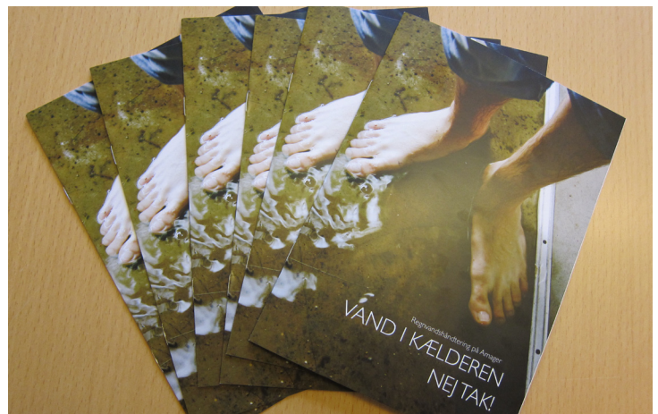
Denne folder giver gode råd til regnvandshåndtering på Amager.

Ud over den online og mundtlige formidling, har vi i 2012 udgivet to skriftlige foldere; Miljøpunkt Amager - a guide to Miljøpunkt Amager's sustainable activities og Vand i kælderen - Nej tak! Den ene er en engelsksproget folder om Miljøpunkt Amager og vores aktiviteter. Den er blevet lavet sammen med en studerende fra Lund Universitet og støttet af de to lokaludvalg på Amager.