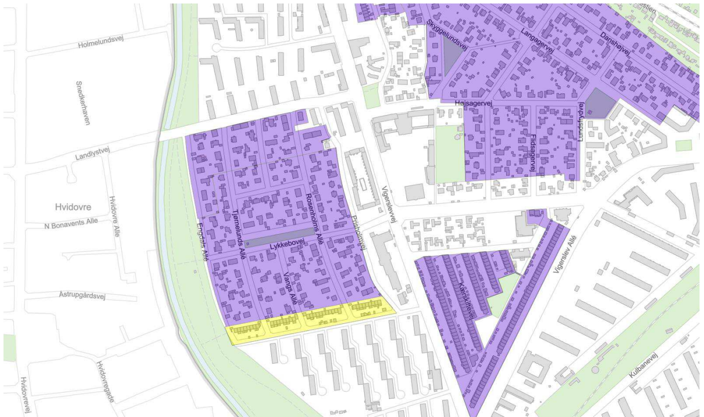
Figur 2. G/F Heldbovænge er markeret med gult og omkringliggende grundejerforeninger er markeret med lilla. .