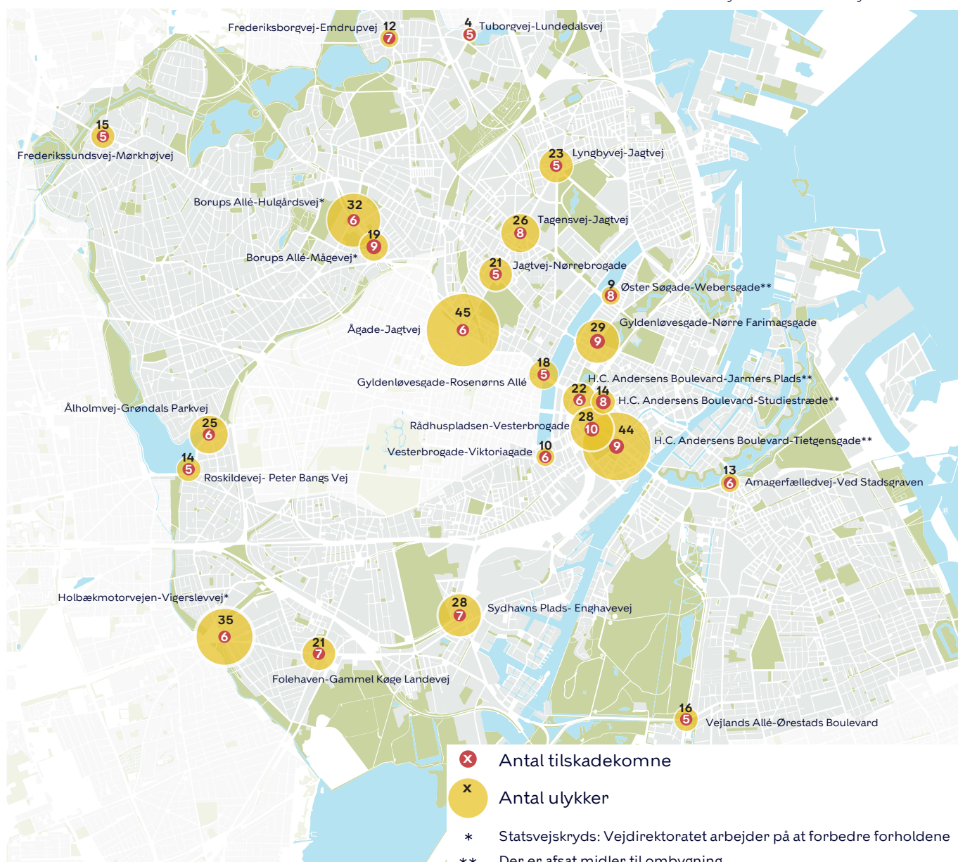
↓ Ulykkesbelastede kryds 2019-2023

Der er ikke en fast definition på, hvornår et vejryds begynder og dermed hvor lang en strækning, der kan betragtes som værende en del af fx et ulykkesbelastet vejryds. Generelt kan det siges, at et vejryds begynder der, hvor der sker en ændring af vejprofilen frem mod krydset. Dette er i mange tilfælde visuelt synligt ved vognbaneskit, skiltning, ændring i vejafmærkningen mv. Det er derfor en konkret vurdering i den enkel-