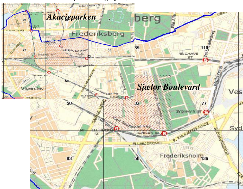
Tabel 1: Politiets tal for kriminalitet i kvm-kvadrater for de to kvadrater indeholdende henholdsvis Akacieparken og Sjælør Boulevard.