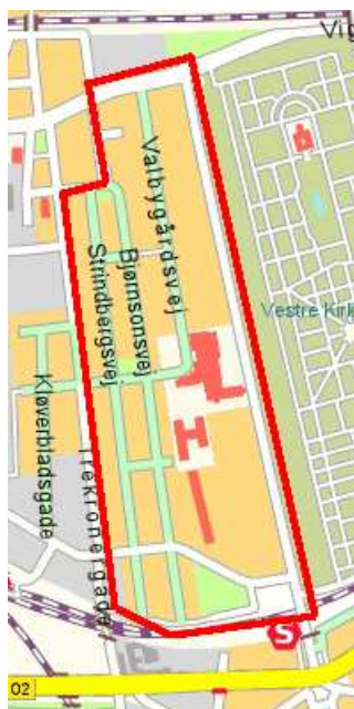
Tegning 3: Sjælør Boulevard området efter Socialforvaltningens inddeling

* Sjælør Boulevard området efter Socialforvaltningens inddeling er markeret med rødt