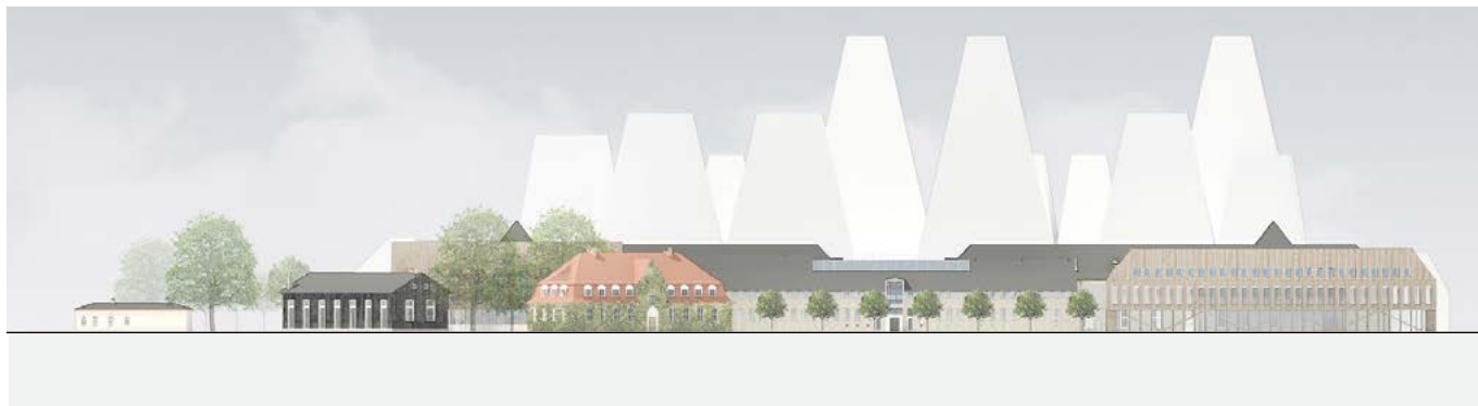
Opstalt langs Danneskiold-Samsøes Allé, der viser sammenhænge mellem eksisterende og ny bebyggelse. I baggrunden ses omridset af ny bebyggelse på Christiansholm