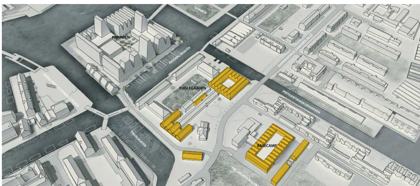
Illustration der med gult viser foreslået ny bebyggelse på Arsenaløen

København skal være en bæredygtig by med byrum, der inviterer til et mangfoldigt og unikt byliv. Kuglegården skal udvikles fra et lukket militært område til et mere udadvendt område, der indgår og spiller sammen med det øvrige Holmen. Særligt Trangravspladsen beliggende på Christianshavnsruten kan blive en attraktiv solrig plads, der med genopførelsen af 'Lystøndeskuret' skaber gode rammer for byliv. Herudover vil der, langs kanalerne være kantzoner, mindre byrum, samt stedvist åbne facader, der skaber sammenhæng mellem bebyggelsen og vandet.