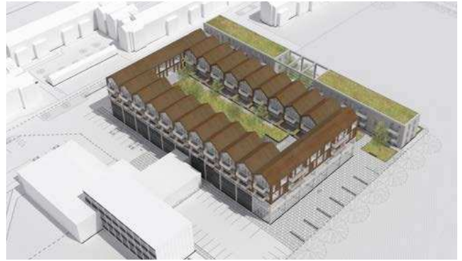
Ny bebyggelse ved Basecamp. Tilbygning på den eksisterende hal, og rækkehuse på grundens østlige side, hvor der nu er garager.

grønne bytræk. Der er ruter langs kanalerne, og de åbne grønne græsletter bibeholdes og udvides ved Basecamp. De eksisterende beplantninger langs facader videreføres ved nybygninger, ligesom beplantningen suppleres med større træer enten byplan-traditionen tro, som enkeltstående solitære træer, i grupper eller plantet som alléer. Denne grønne del udbygges med en langt større artsrigdom og med en større biodiversitet til følge.