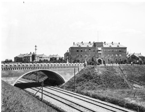
Kortudsnit: År 1879 og 1939. Historisk Atlas.

Hærens Gymnastikskole ses som den korsformede bygning på kortet fra 1939 nedenfor. Hele idrætsanlægget indgår i de kulturhistoriske bevaringsinteresser.