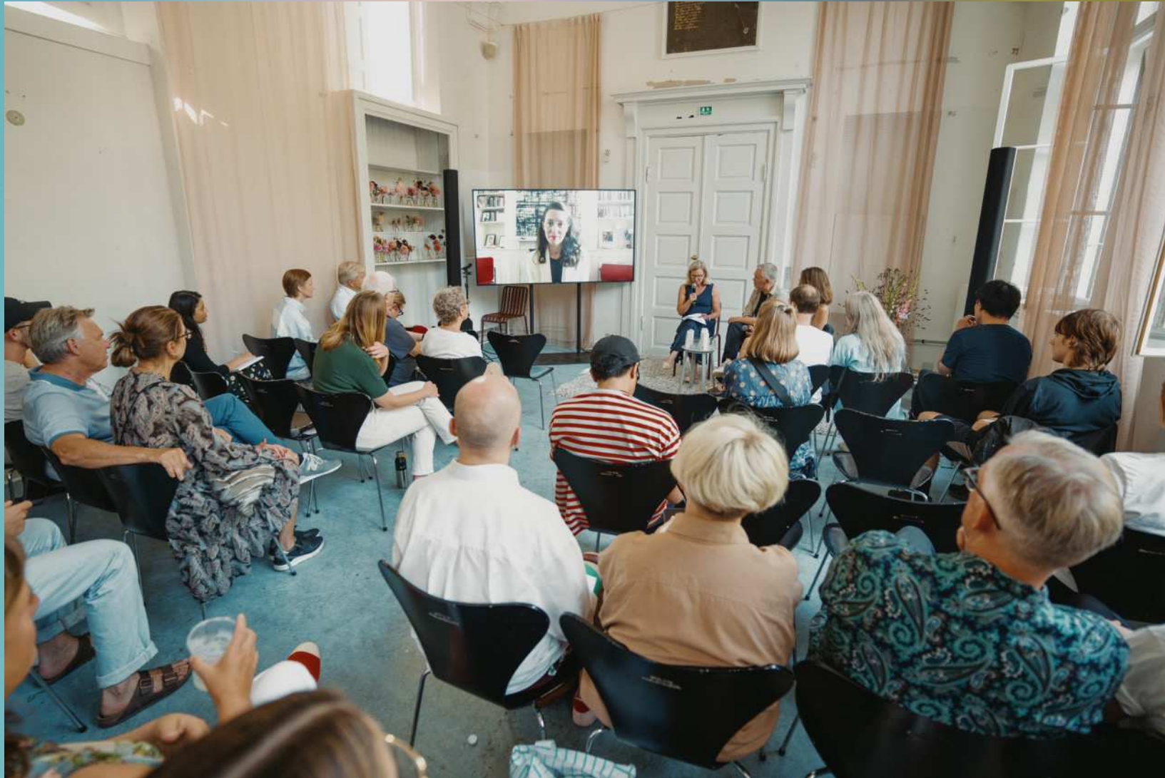
CHART Talks program 2022