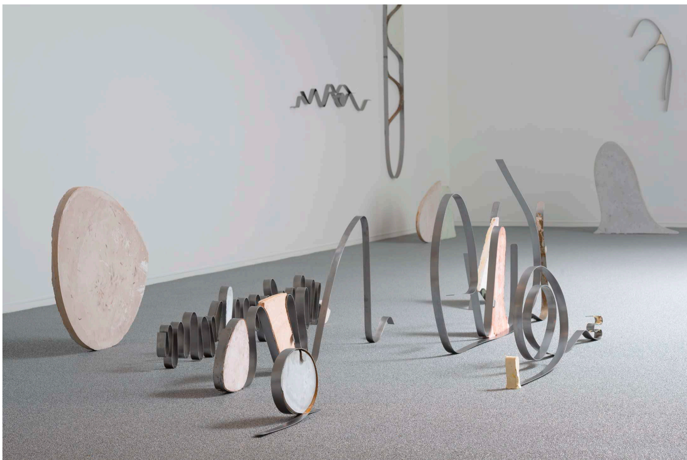
an oval, a vowel, an e Marie Raffn Spatial drawing. One of the sculpture groups, approx. 500 x 280 x 75 cm. Steel and dyed plaster casts. Vestjyllands Kunstpavillon (solo), Vibebæk, 2021