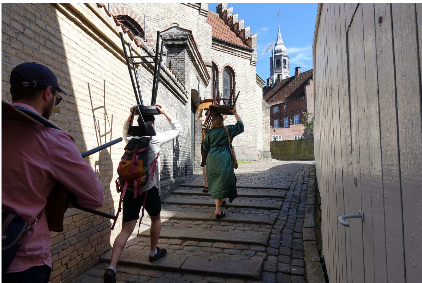
Maj Horn. Et performativt møde mellem 1000fryd, Huset og Det Grønlandske Hus, Mapping of the Movable Aalborg, 2020