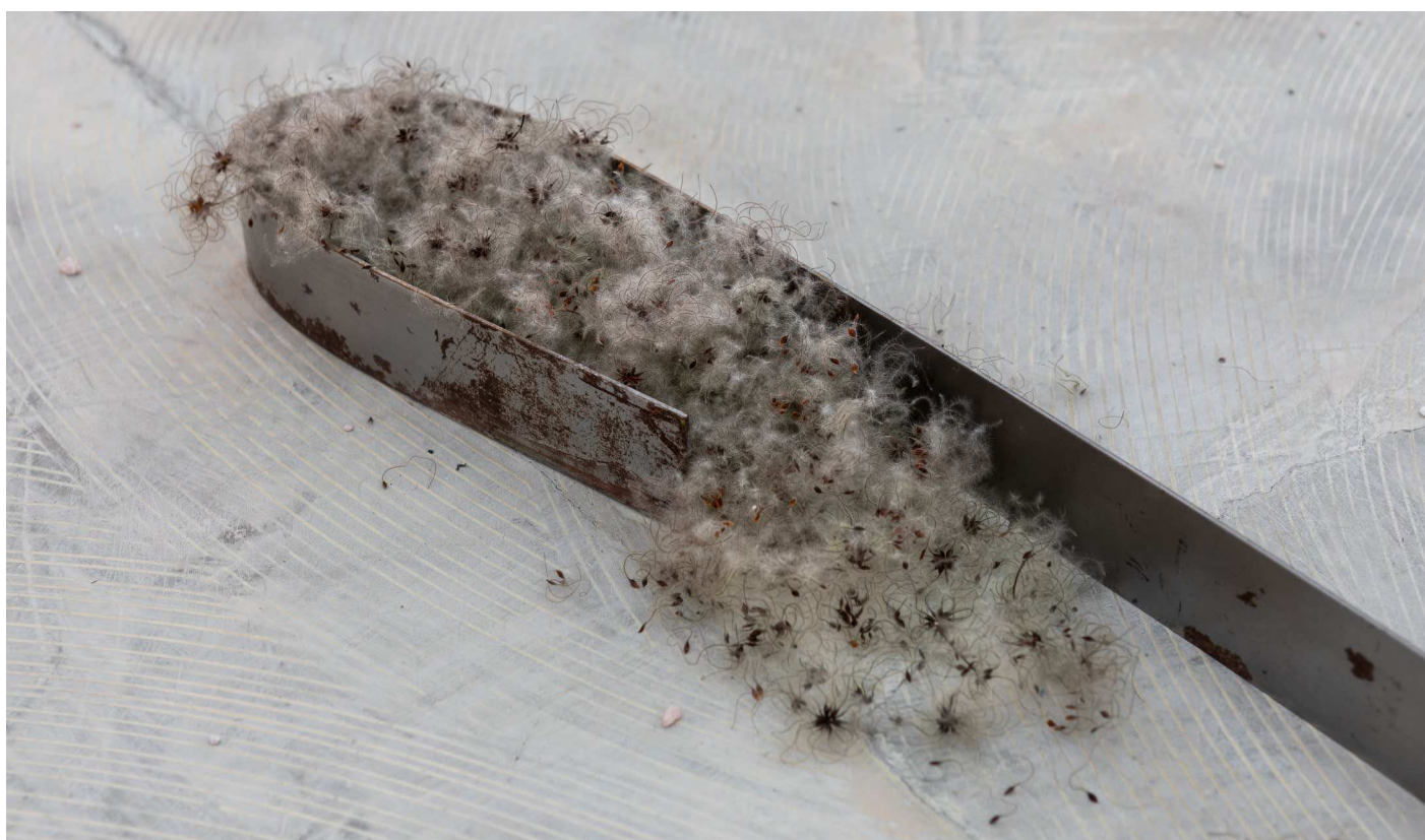
Rhipidium fan bloom

Marie Raffn. Detail of floor based sculpture, 250 x 130 x 10 cm.