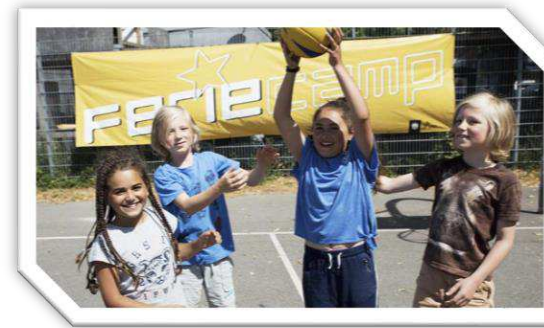
Forebyggende indsatser (FerieCamp, FritidsGuider, kontingentsstøtte, sociale partnerskaber mm.)