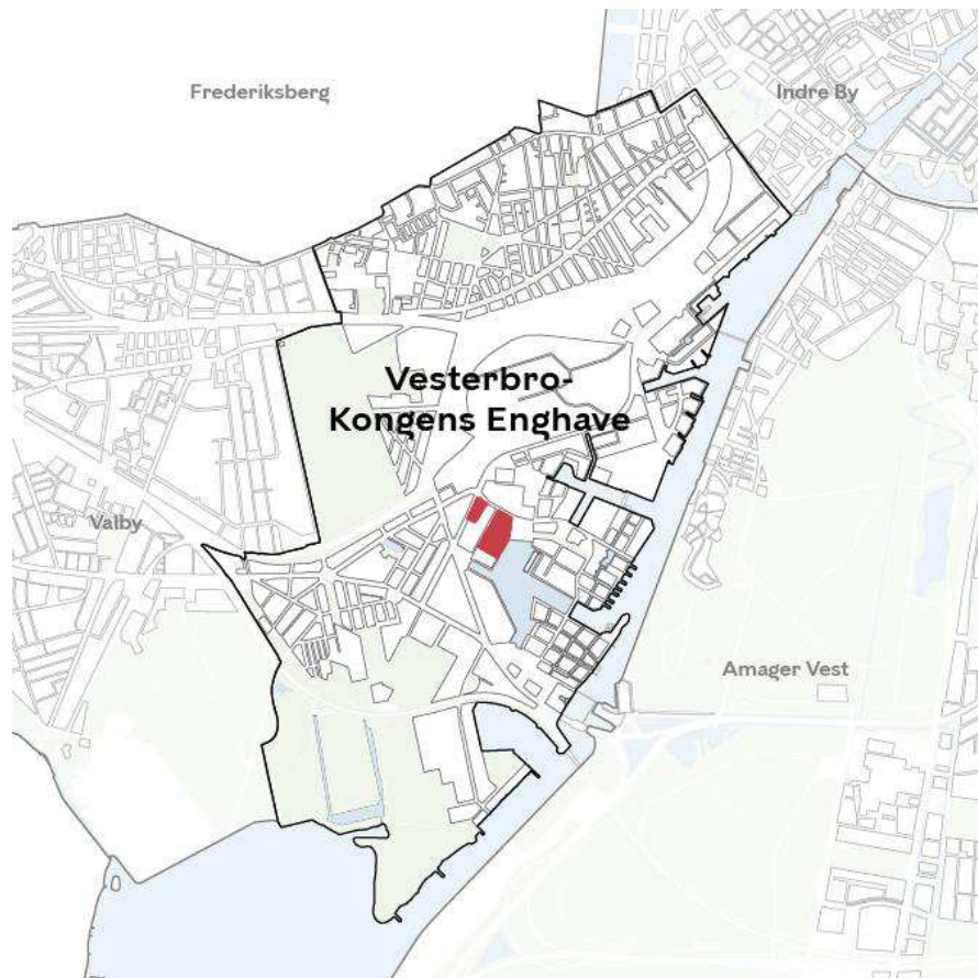
Områdets placering i bydelen.

Klima og Byudvikling Område for Byplanlægning Njalsgade 13 2300 København S