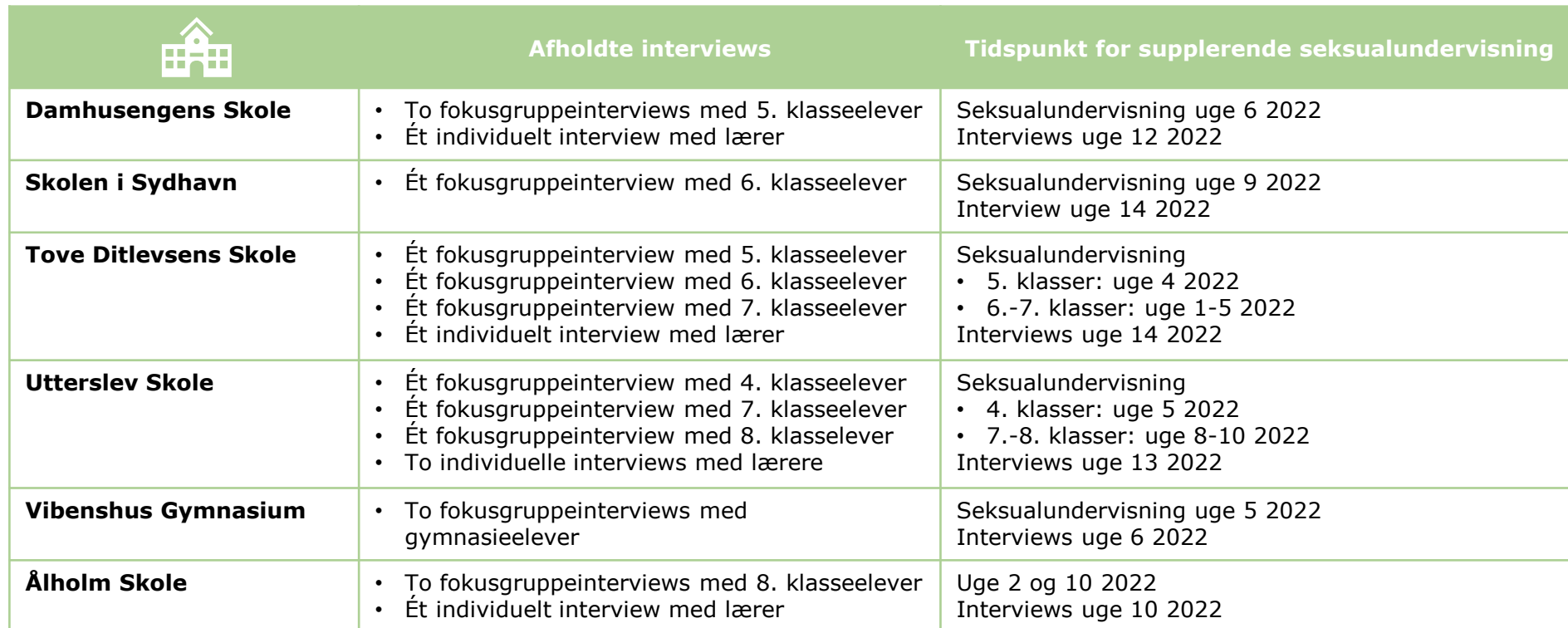
Tabel 1. Overblik over afholdte elev- og lærerinterviews