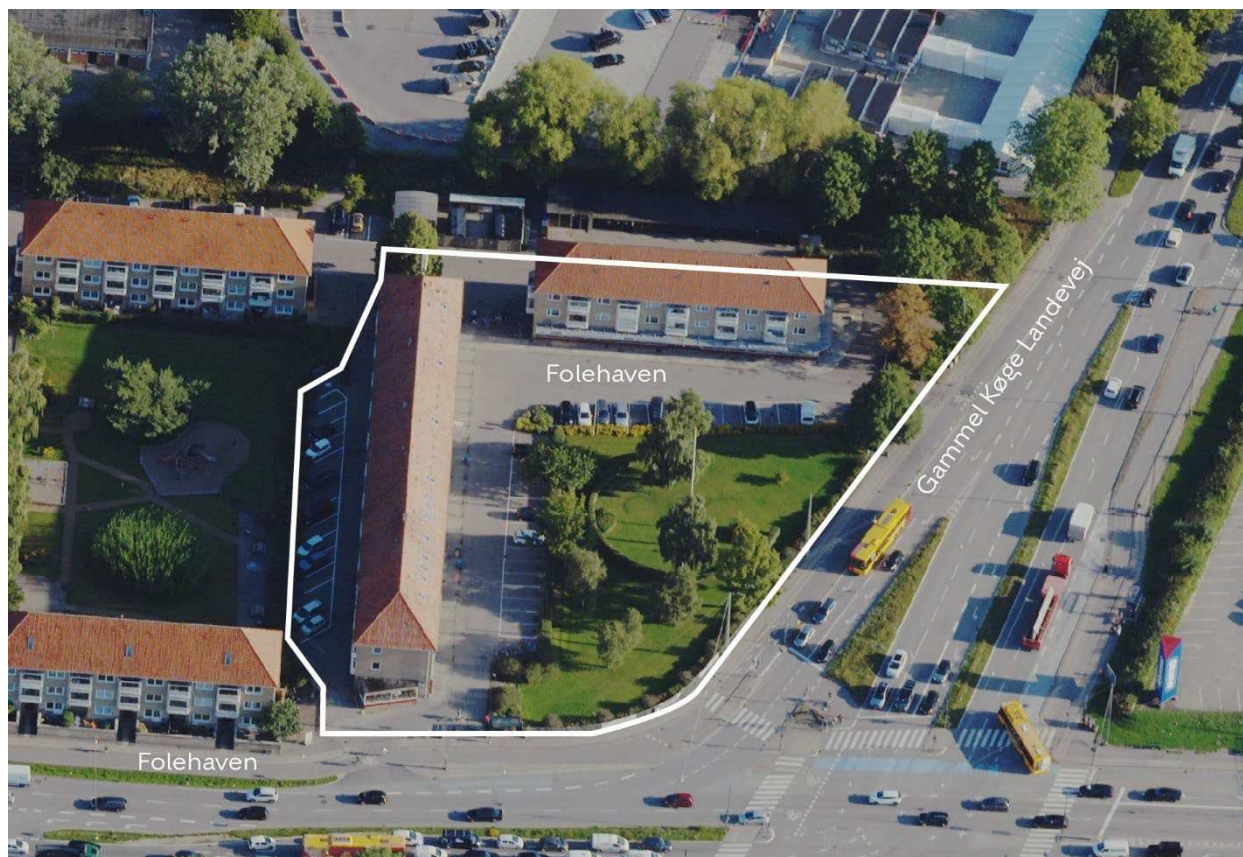
Området set mod nord. Lokalplanområdet er indtegnet med hvid linje, og de vigtigste gader er navngivet.

Forvaltningen forventer, at der vil kunne fremlægges en startredegørelse til politisk behandling inden for 2. kvartal 2023.