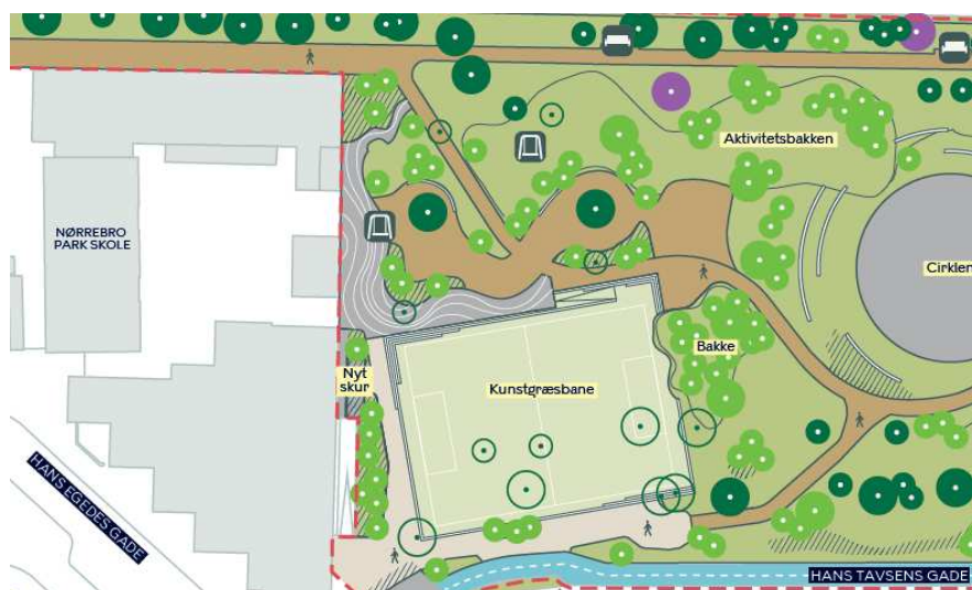
Udsnit af projektforslag for parken indeholdende en 5v5 kunstgræsbane