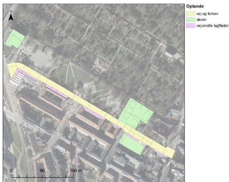
Figur 2: Oversigt over de arealer, der skal afkobles.