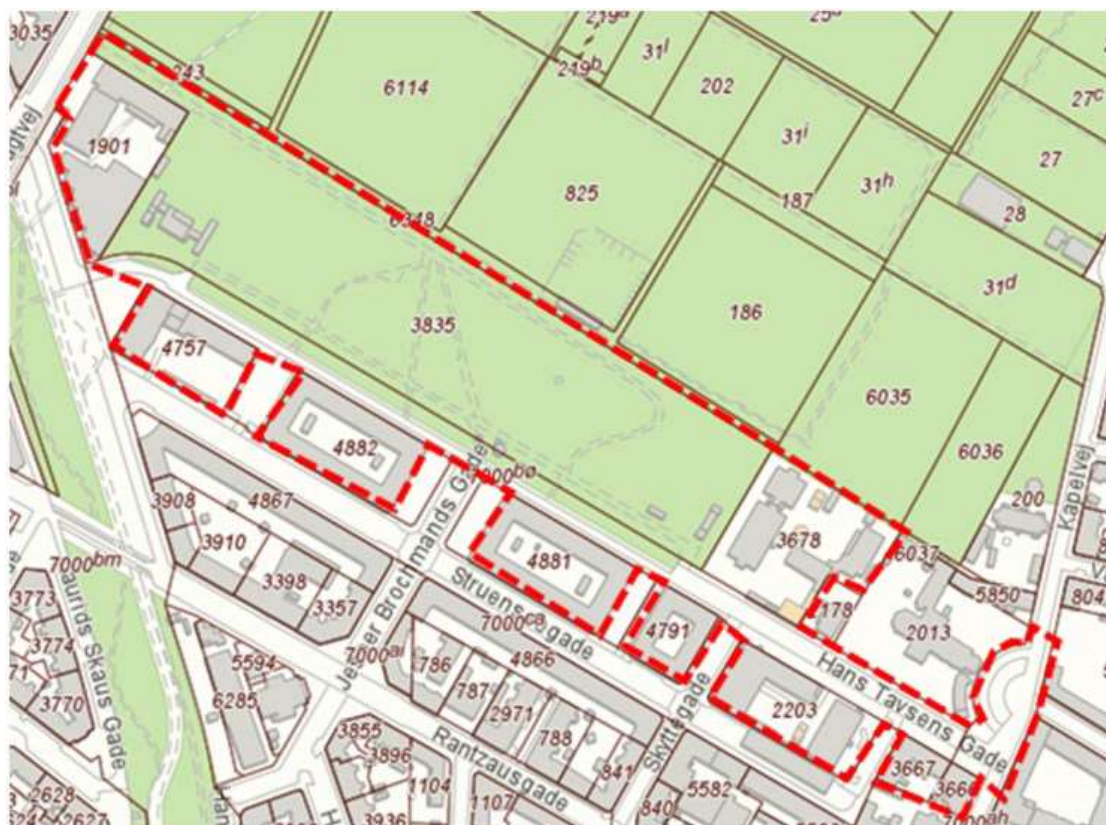
Figur 1: Matrikler, der skal delvist separatkloakeres.