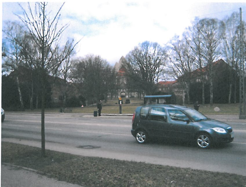
Foto 2. Udsyn mod Grundtvigs Kirke set fra Vestre Længdevej