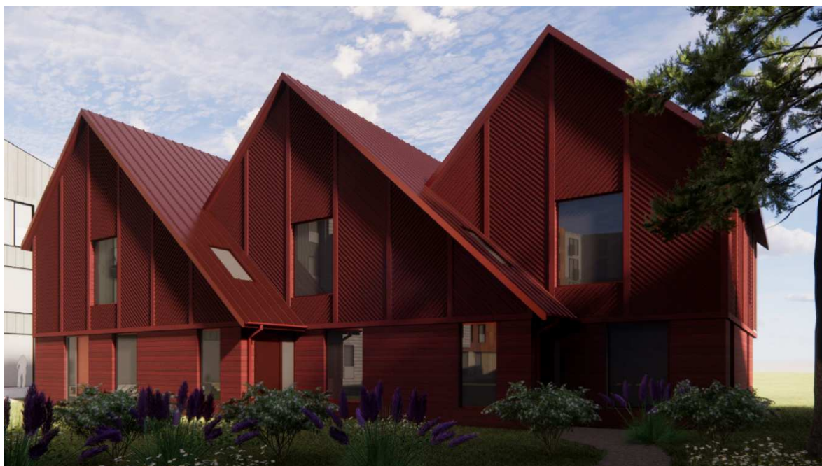
Bebyggelsen set fra gårdrummet.