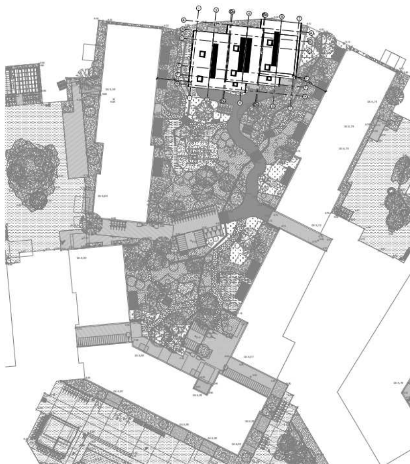
Situationsplan bebyggelse C4. Illustration/afsender: Fælledby P/S