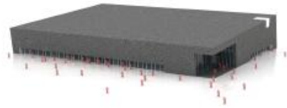
Facade og tag danner en samlet form, hvori der laves dybe snit / udskæringer